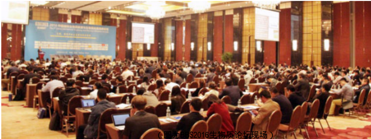
(图为BBS2016生物质论坛现场)