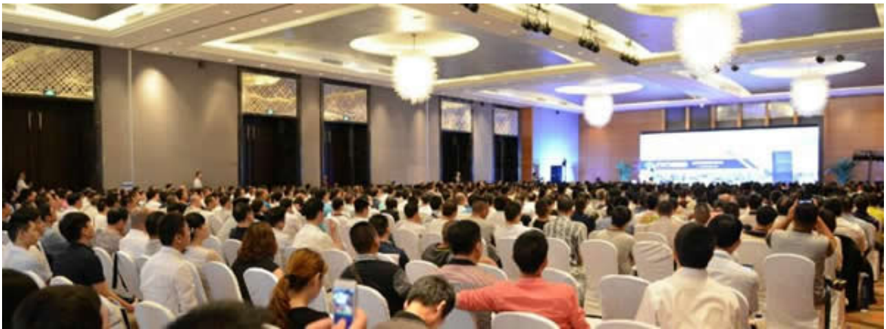
亮点四：众多行业领先企业与行业协会组团，汇聚高质量买家

本届展会将呈现多场精彩论坛，包括：深圳国际锂电技术高峰论坛、2017先进电池与材料研讨会、2017动力电池发展大会、2017正负极材料技术发展论坛、2017锂电隔膜技术发展研讨会、2017新能源电动汽车发展大会、2017超级电容器应用研讨会，2017中国石墨烯技术应用论坛、2017深圳国际移动电源及快充技术发展论坛、2017全球充电桩发展大会这些活动不但具有极强的专业性，更能够帮助参观者更准确的把握行业市场脉搏，优化采购决策，不容错过。同期活动议程可查询深圳锂电技术展官网查看