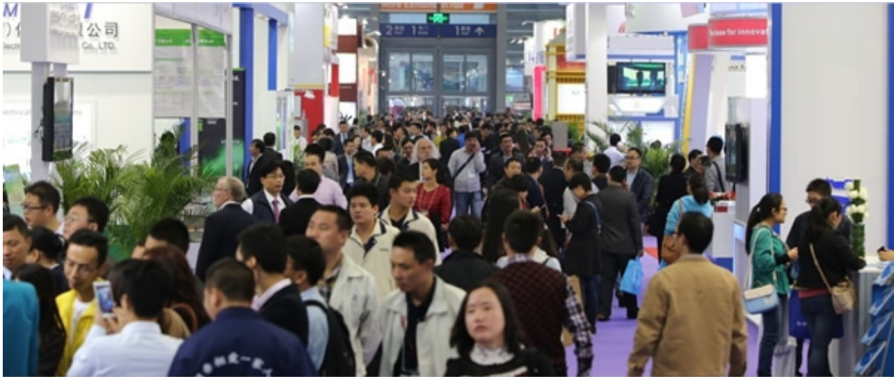
亮点三：多场专业论坛，协会活动、全方位覆盖行业热点

本届展会将呈现多场精彩论坛，包括：深圳国际锂电技术高峰论坛、2017先进电池与材料研讨会、2017动力电池发展大会、2017正负极材料技术发展论坛、2017锂电隔膜技术发展研讨会、2017新能源电动汽车发展大会、2017超级电容器应用研讨会，2017中国石墨烯技术应用论坛、2017深圳国际移动电源及快充技术发展论坛、2017全球充电桩发展大会这些活动不但具有极强的专业性，更能够帮助参观者更准确的把握行业市场脉搏，优化采购决策，不容错过。同期活动议程可查询深圳锂电技术展官网查看