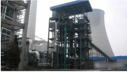
国电长源10MW级生物质气化耦合发电