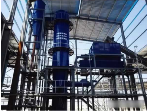
江西泰新3MW级竹屑（秸秆）气化多联产