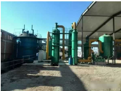
河北平泉3MW级杏壳气化多联产