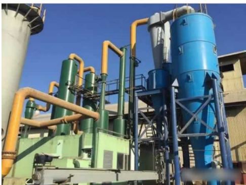
盛博1MW级稻壳气化发电