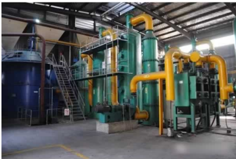
湖南谷力2.5MW级稻壳气化多联产