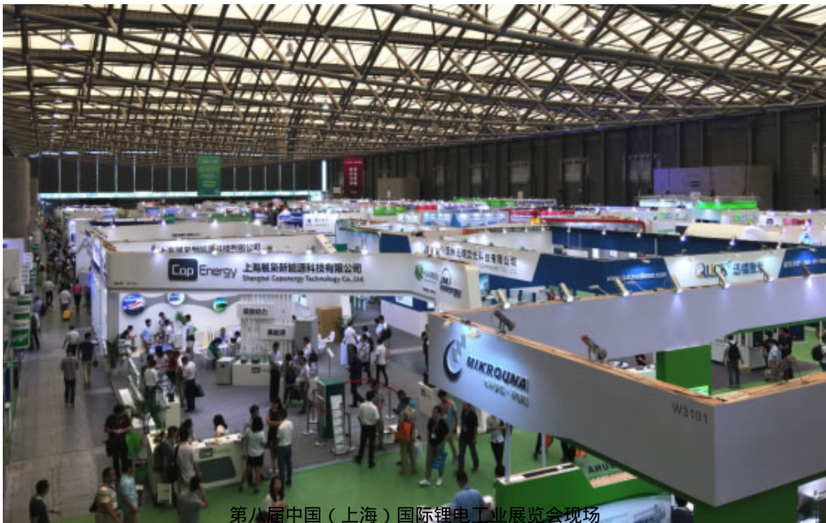
第八届中国（上海）国际锂电工业展览会现场

基于对市场前景的看好，众多锂电设备企业纷纷加大技术创新和品牌推广力度，加快扩张市场份额。当前市场的火热程度，在即将于2017年8月23-25日上海新国际博览中心举行的第九届中国（上海）国际锂电工业展览会（CNIBF2017）有充分体现。据悉，该展会由充电设施在线网、广东省充电设施协会、广东省新能源汽车产业协会和振威展览股份主办，中国土木工程学会城市公共交通学会协办，展示面积近60,000平方米，800多家企业将亮相，是中国最大锂电展。