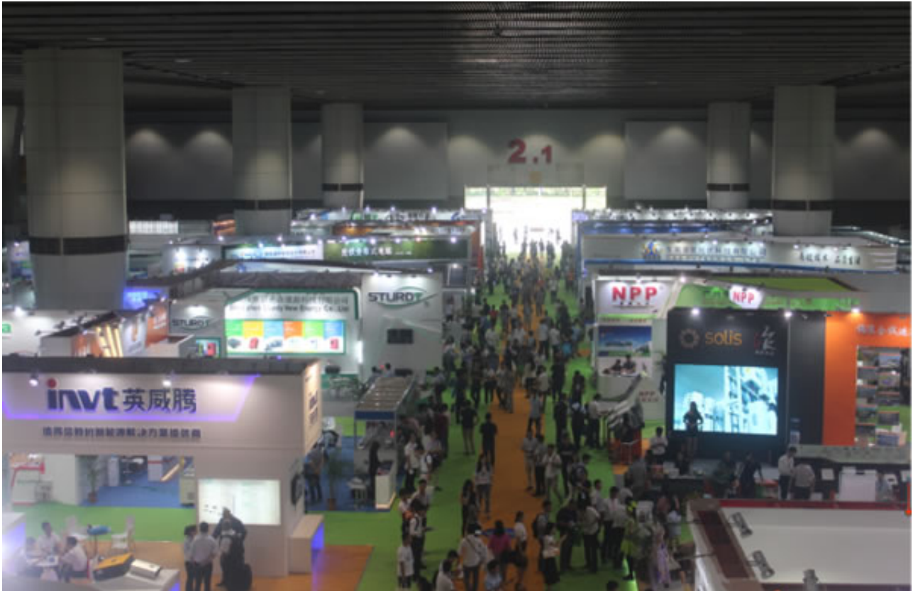
知名企业齐亮相，引领行业新风向

风和日丽，万里无云，羊城八月，天公作美。由广东鸿威国际会展集团有限公司主办，南方电网综合能源有限公司、顺德中山大学太阳能研究院、广东省太阳能协会、深圳市中小企业促进会、中国光伏应用创新联盟、广东省循环经济和资源综合利用协会共同协办的“第九届广州国际太阳能光伏产展览会”（PV Guangzhou）于2017年8月16日至8月18日在中国进出口商品交易会展馆A区圆满举行。本届展会展出面积36000平方米，汇集数百家海内外知名展商，是国内外品牌拓展中国市场的重要通道，是布局全球网络的最佳渠道，是光伏行业年度新品发布重要平台及贸易导向。配合“‘一带一路’光伏产业发展高峰论坛”、“光伏进万家，科普万里行（广州站）”等多个同期会议及活动，为太阳能光伏业内人士打造丰富多元化的观展旅程。本届展会主要展示生产技术及研究设备、光伏生产设备和太阳能光伏应用产品等三个方面的产品，观众可更针对性地找寻目标设备供应商，深度了解太阳能光伏国际前沿技术及设备。