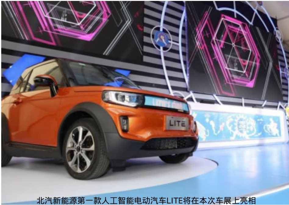
北汽新能源第一款人工智能电动汽车LITE将在本次车展上亮相