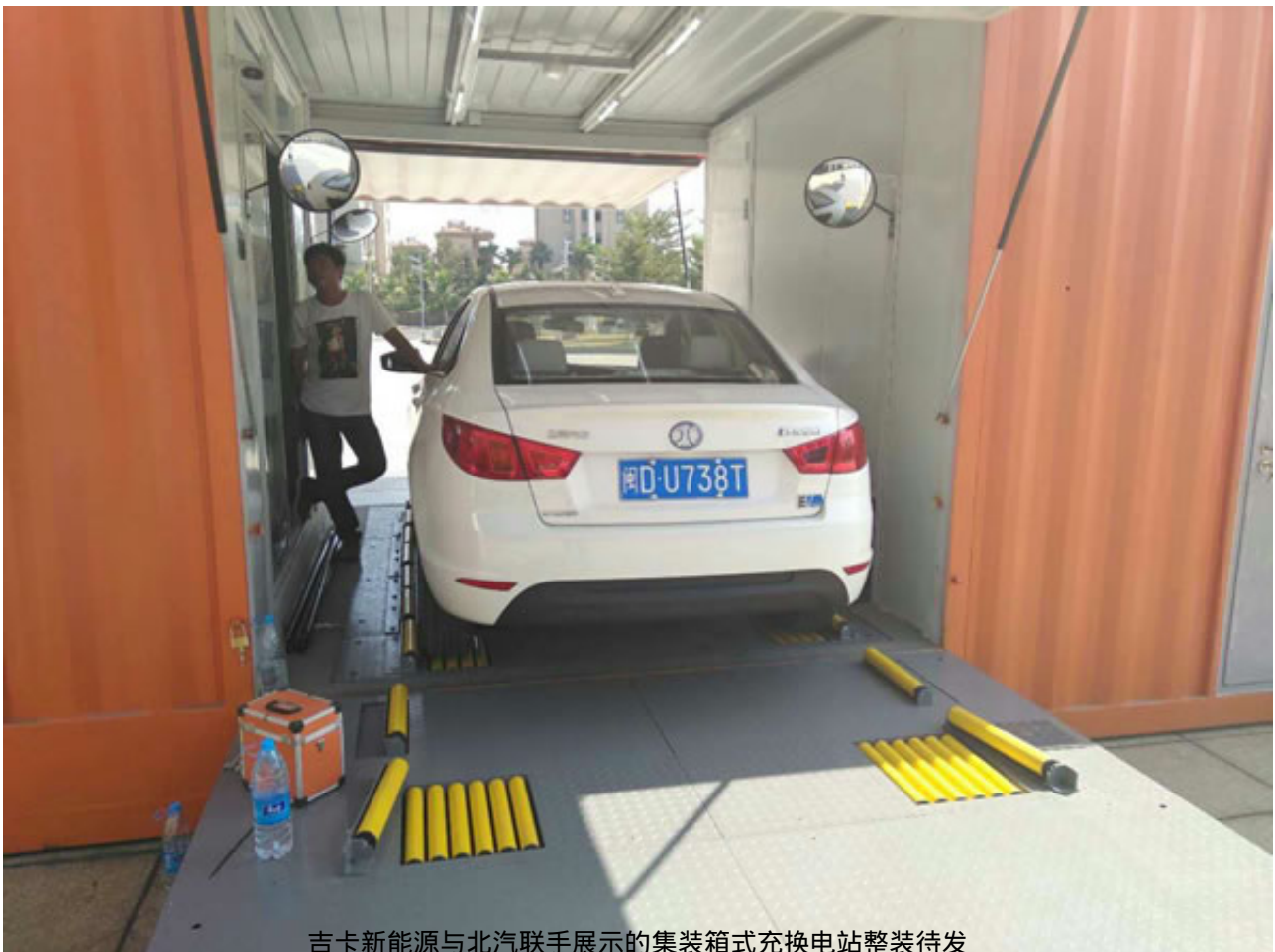
吉卡新能源与北汽联手展示的集装箱式充换电站整装待发

据悉，本届展会目的是搭建行业对接交流和产销合作平台，凝聚各方合力，促进新能源汽车在全社会的推广应用，推动全省新能源汽车产业发展，推进海南全域旅游示范省和国际旅游岛建设。