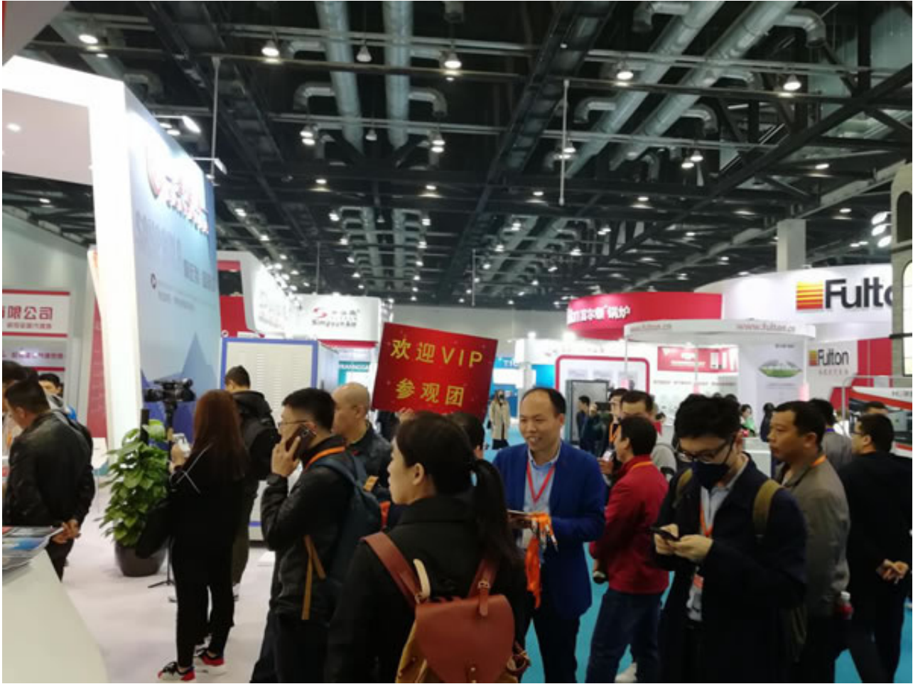
展会现场来自全国各地的数万名行业观众纷至沓来，齐聚北京，共襄盛会。