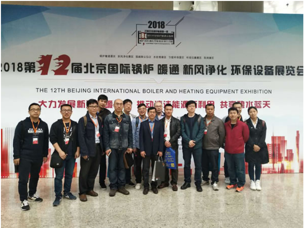
2018年4月2日，春光明媚、阳光和煦，年度行业权威展会2018 IBE第12届国际锅炉暖通、新风净化、环保展览会在北京·国家会议中心正式拉开帷幕。