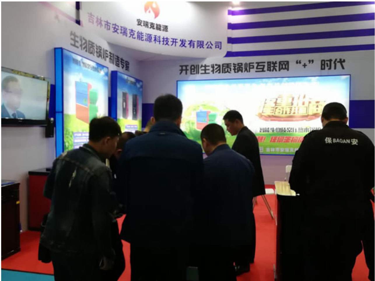
北京电视台、中国教育电视台、新华社、优酷视频、腾讯视频、山东电视台等近30家媒体对大会进行了采访报道。