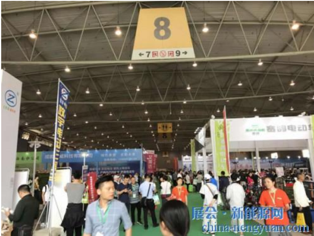
(展会现场人气爆棚)

5月4日，第四届成都国际电动车及新能源汽车展览会在成都世纪城新国际会展中心隆重召开。本届展会由振威展览股份、四川省汽车工程学会、四川省汽车产业协会共同主办，成都振威世展展览有限公司承办，展示面积突破40000平方米，开展第一天参观人次约21000人次。