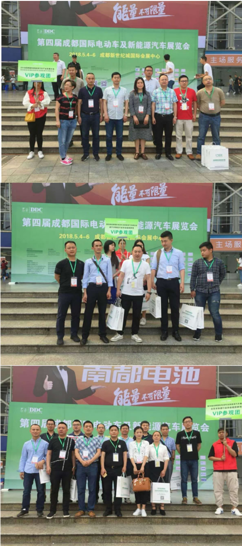
(专业参观团莅临展会参观采购)