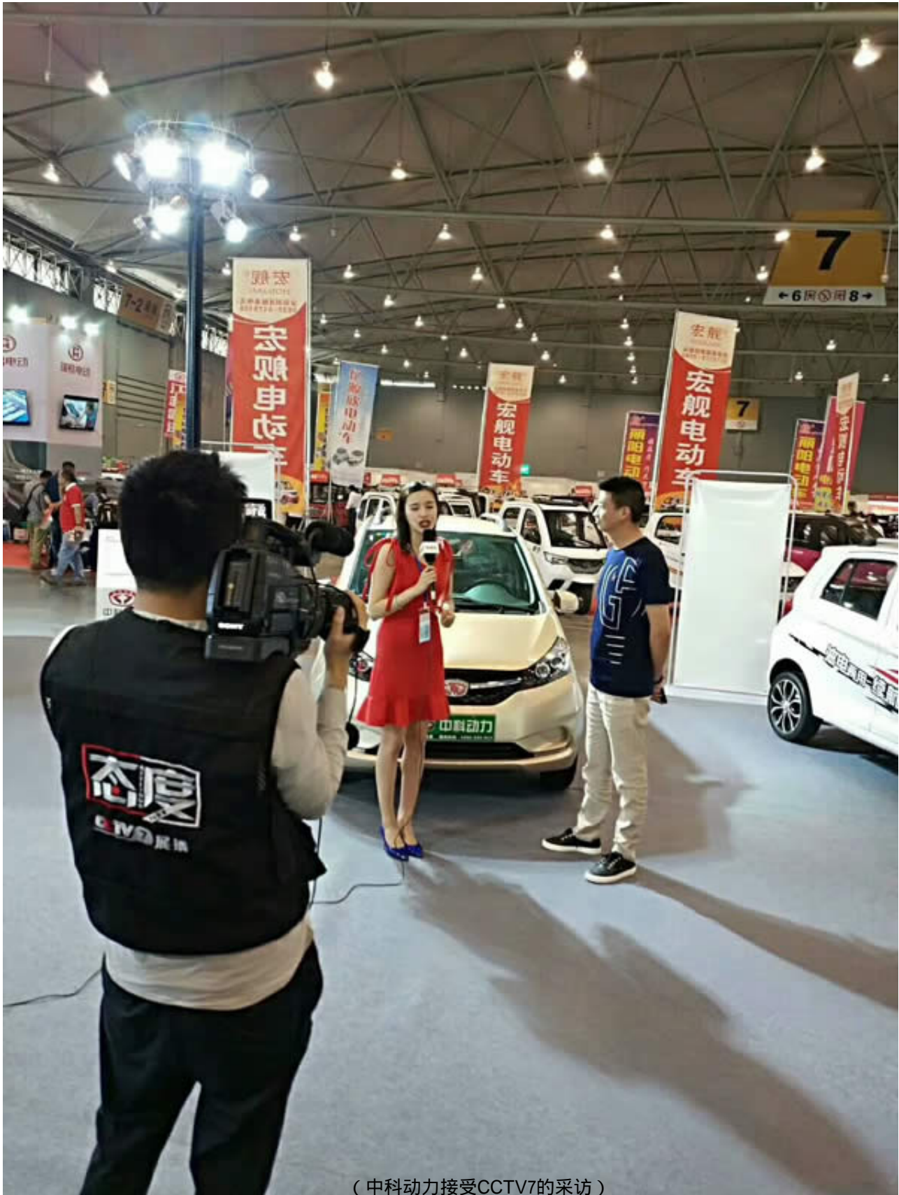
( 中科动力接受CCTV7的采访 )

成都电动车展吸引了成都易速物流有限公司、遂宁市物流行业协会、四川省现代物流发展促进会、成都市物流协会、雅安市快递协会、中铁快运股份有限公司成都分公司、凉山州快递行业协会、乐山市邮政管理局、乐山市快递行业协会、达州市快递行业协会、遂宁市快递协会、遂宁市邮政管理局、绵阳市快递协会、自贡市快递行业协会、成都市