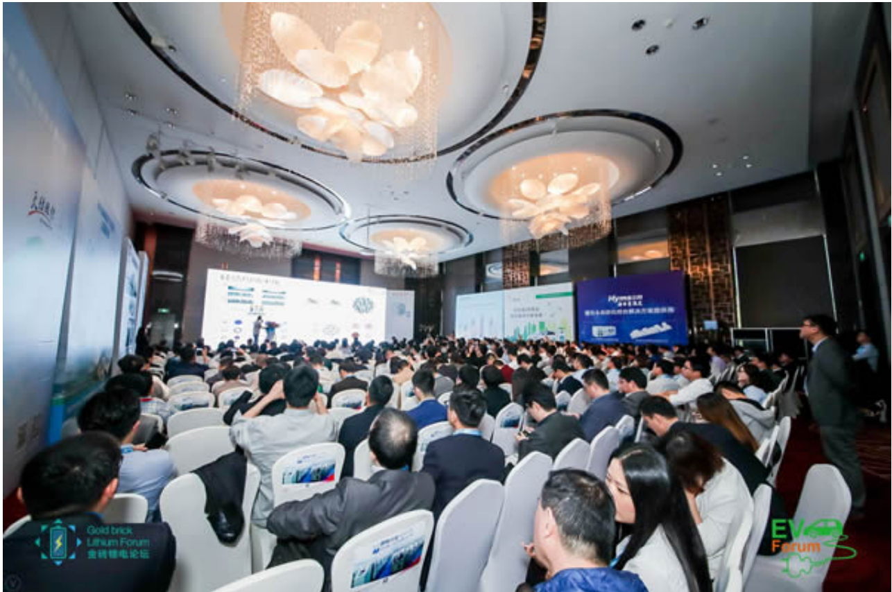
缤纷同期展，成就2018深圳锂电技术展览会完整产业链的专业展示平台

2018第二届深圳国际锂电技术展，将同期同地举办2018深圳国际电动汽车及技术展，2018深圳国际储能技术展览会，2018深圳国际氢能与燃料电池技术展，2018深圳国际充电桩技术设备展，2018深圳国际移动电源及无线充电展。这些展会或与动力锂电和技术相关，或与创新应用相关，展商们将共享来自动力锂电，储能锂电，3C锂电全产业链上下游。