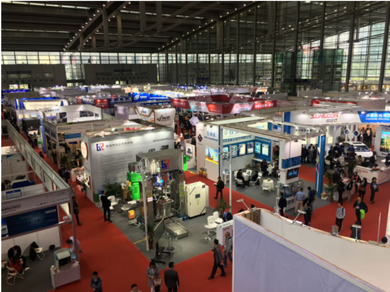
六大机构联合组团参加深圳锂电技术展，彰显实力派和影响力