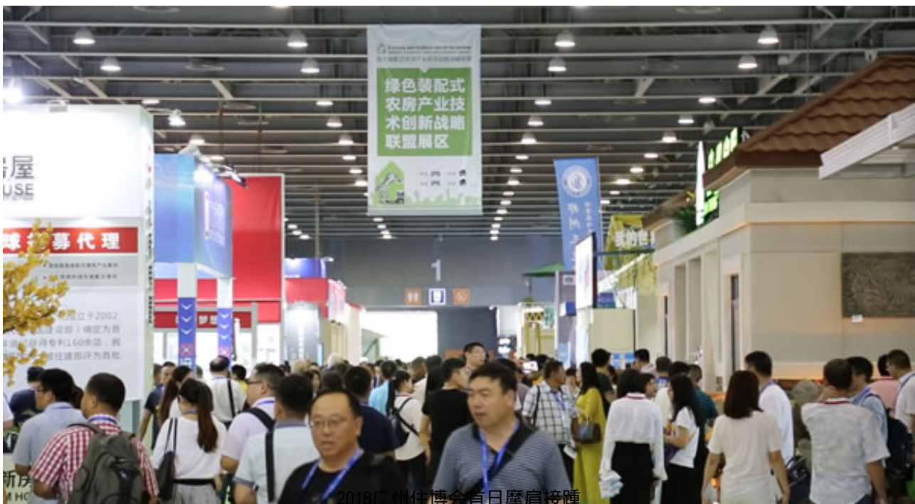
2018广州住博会首日摩肩接踵

随着国家政策对装配式建筑、钢结构、木结构等新型建筑材料的大力推进与发展，对新型集成式住宅行业感兴趣的人数与日俱增，展会上，2018中国（广州）国际集成住宅产业博览会5馆连开，总面积达5万平方米，有望吸引8万观众前往会展参观。住博会聚集了众多居住产业知名品牌、国内外工业化产品与设备，集中展示各地节能环保型住宅的成套住宅产业化技术，给了人们一窥“明日都市”风采的良机。