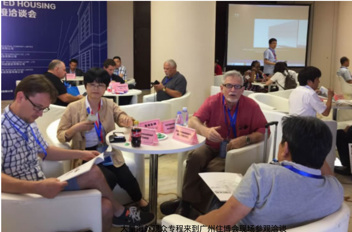
大量海外观众专程来到广州住博会现场参观洽谈