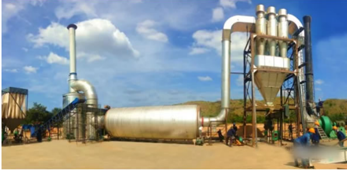
泰国现场设备安装