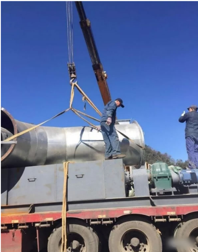
印度烘干设备安装