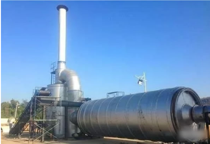
文山烘干干燥设备现场