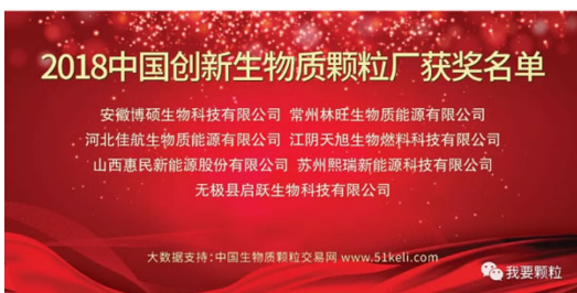
《2018中国创新生物质颗粒厂》获奖企业名单