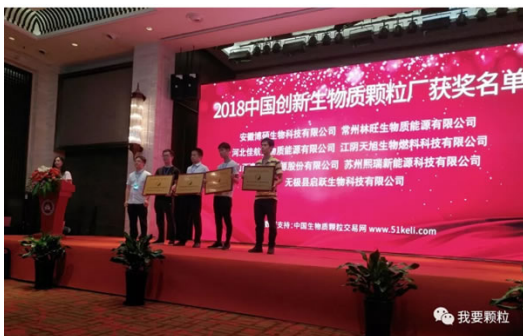
《2018中国创新生物质颗粒厂》获奖企业代表授牌