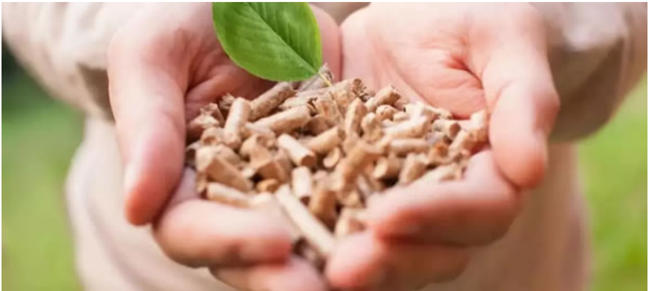
行业旗舰盛会 企业沟通桥梁

《中国新能源网》是中国领先的新能源信息平台。2017年初，旗下推出《中国生物质颗粒交易网》以及《颗粒通》服务体系，为中国的生物质成型燃料产业发展提供了强大的数据支撑平台。目前已有超过900家颗粒企业注册加入了此大数据平台，为行业采购和企业推广提供了极其便利有效的信息渠道。根据实时统计，51keli平台燃料供应量已突破600万吨大关，据估算已占全国生物质成型燃料供应总量的15%-20%。本次大会依托于众多成型燃料企业，并纵贯其上下游产业，必将创造前所未有的影响力和覆盖面。