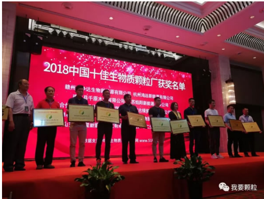
《2018中国十佳生物质颗粒厂》获奖企业代表授牌