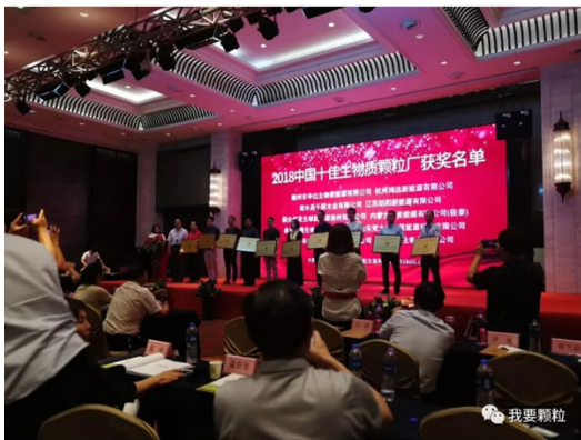
《2018中国十佳生物质颗粒厂》获奖企业代表授牌