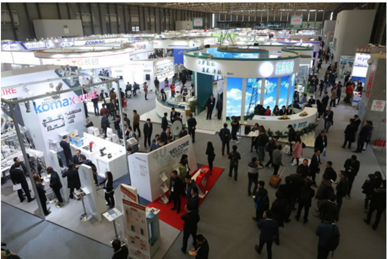
ABB(中国)有限公司 (展台号：8A15)