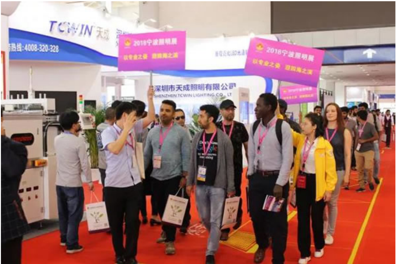
2019展会全新起航 展会规模继续扩大

其三是展会国际化程度的不断提高：历经几年的境外客商邀请和宣传，展会的国际化程度稳步提高，吸引了大批外资企业前来参展，目前展会国际化程度以超30%。通过展会搭建的平台，诸多境外客商、外资企业等将先进的研发理念、核心技术带入中国市场，更多的国内照明产品进入国际市场。