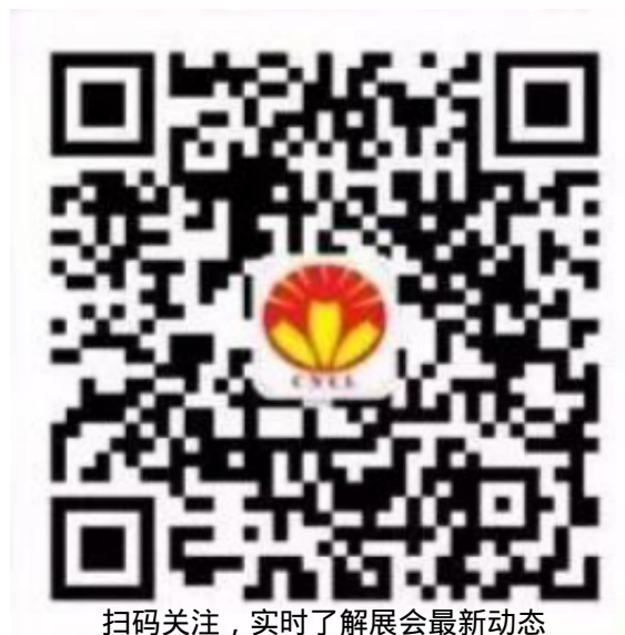
扫码关注，实时了解展会最新动态