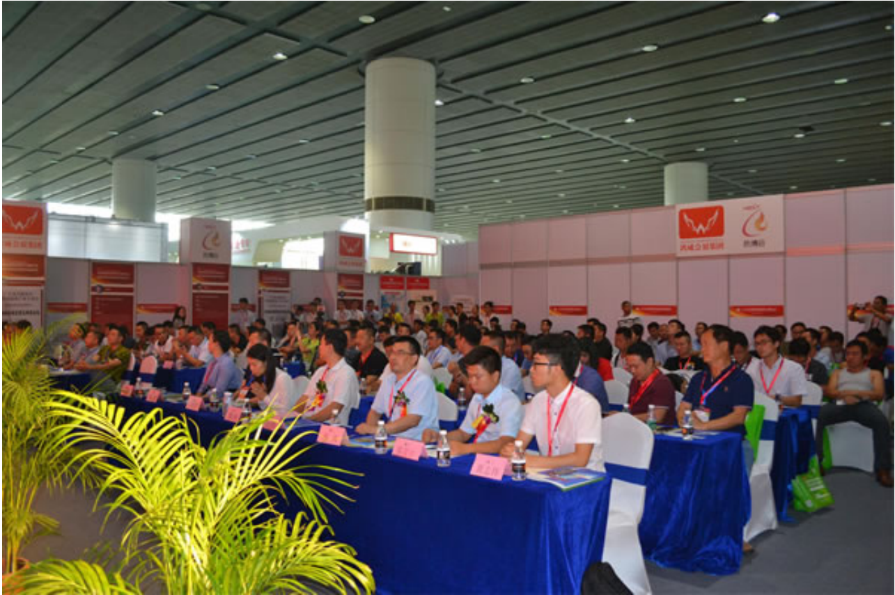
专项资金扶持，前100名补贴参展

2019中国国际（成都）供热暖通展紧紧把握供热暖通产业发展新趋势，紧贴国家政策与市场热点，得到相关部门大力扶持！为了推进西部清洁供暖有效实施，同时配合鸿威国际会展集团五年上市计划，扶持集团旗下不少于30个、面积分别达5万平方米以上的大型品牌会展项目，2018年9月，广东鸿威国际会展集团联合了政府、国内知名投行对中国国际（成都）供热暖通展参展企业补贴参展！前100名申请及中国热能博览会客户将优先享受补贴参展名额，补贴后仅收取4000元/个/9平方米左右。补贴对象包括为国内注册，从事热能、热力、供热、暖通、能源行业合法正规企业。