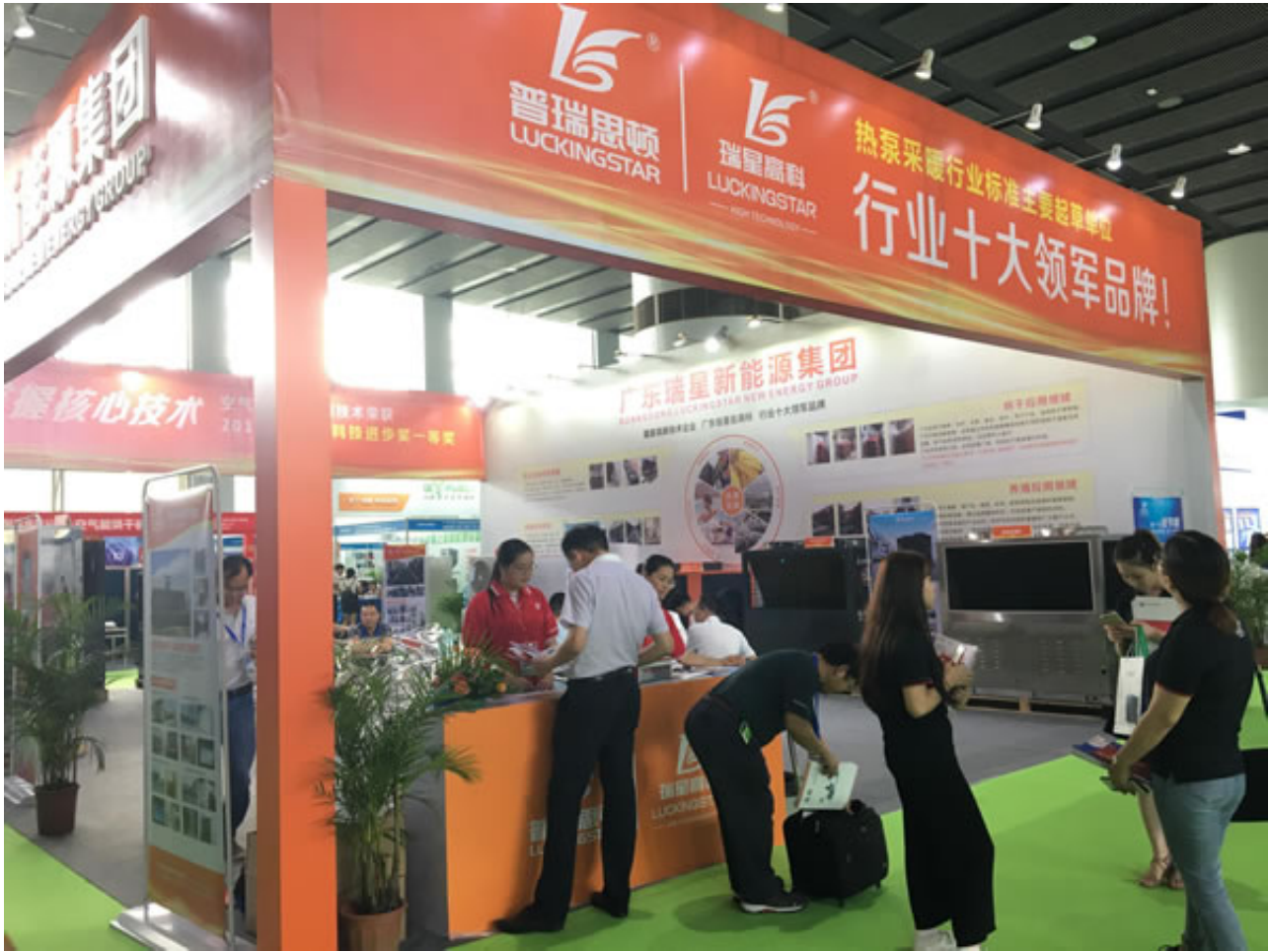
中国热能博览会强大资源助力品牌升级

中国热能博览会（热博会）成功举办14届，涵盖锅炉、燃烧设备、烘干/干燥设备、空气能（热泵烘干）、生物质能、太阳能、电热、热水等领域，已建立80万强大的供热、暖通、能源系统庞大数据库。2018热博会观展人次达10万人次，总计8大展馆，10万平方米，参展企业1200多家，锅炉品牌企业奥地利POLYTECHNIK、迪森、双良、劳士特、绿野、聚能、南方绿鼎、先创股份、双峰锅炉、地中海、常锅、国邦、绿探、巨烽、宜工集团、四通、粤威、定源、托普达、太平洋、汇聚、大唐、特安、大驭、德力升、皓龙、世纪兄弟、泰灵、洁特丽、天溢、华源、兴旺、翔能、达士通、佳先、晶之锐、平建、安冬、恒泰、悦丰、博恩、绿威、宏胜达、劳博、元亨、洲博、卓伟、奥飞、环渝、德博、特能机电、宝杰、火尔赤、蒙特、锋渝、淄柴、金维、星源、晖丰等；低氮燃烧器品牌华之邦、美国ZEECO、意大利欧保、韩国水国等；烘干设备品牌企业正旭、同益、瑞星、威而信、歌思沐、碧涑、澳伯特、远大、双正、冠中、碧朗、金抡、科阳、合派、集木蓄能、沙漠之星、雄贵、蓝冠、龙泰、锦沐、汉晟、美科、创宜蜂、共赢、锦沐、天力、航大、百奥、美科、九沐、佰什特、光海、三人行、东成、创想、百福等一同盛装亮相。Heat China同时还吸引了汉能、三晶、隆基、晶澳、古瑞瓦特、五星、爱康、南方电网、首航、英腾威、力和海得、川田、盛利、韩进、双丰、汇晶、国新、天成、诺城、亚兴、美澳、灵其、环球、德图、晖丰、柘科、艾迪威、擎立、晖丰、法国凯茂、法恩、友谊、奥丽斯特、威能、诺旭、奕优等优秀品牌参加。