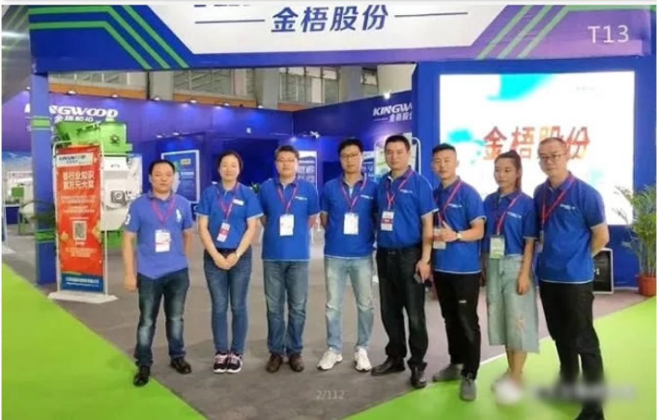
政策支持 技术路径可行 生物质发展前景广