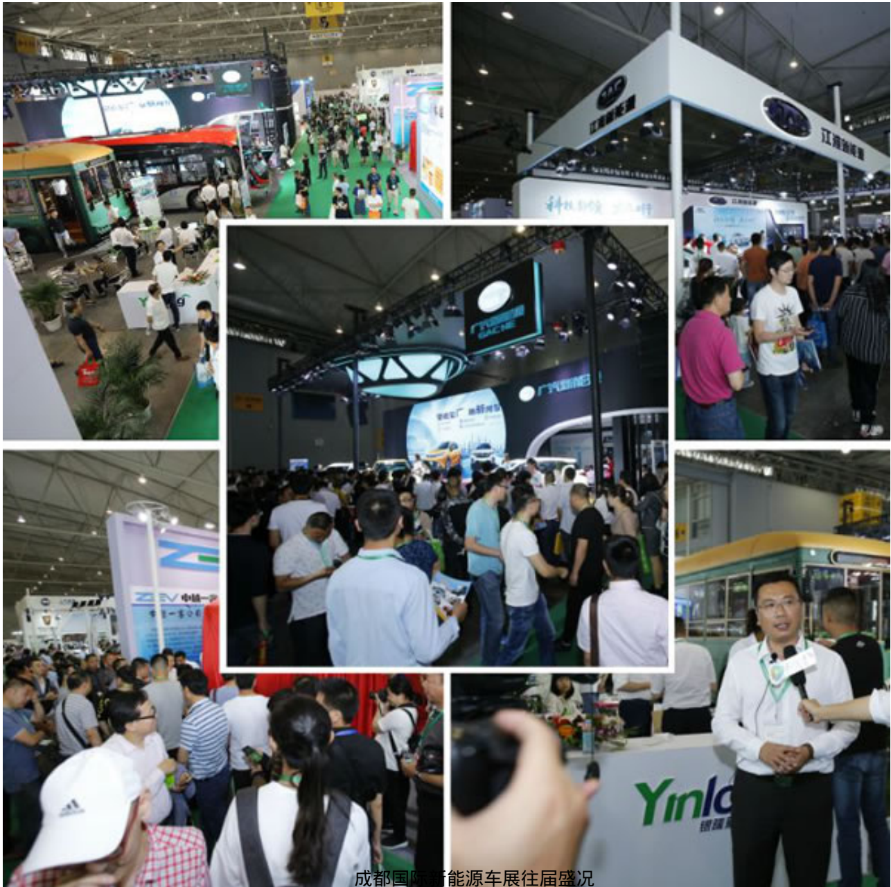
成都国际新能源车展往届盛况

2019第五届成都国际新能源车展由UFI国际展览业协会理事单位、中国会展经济研究会副会长单位、中国国际商会会展委员会副主席单位、全球会展综合服务商振威展览股份重点打造。