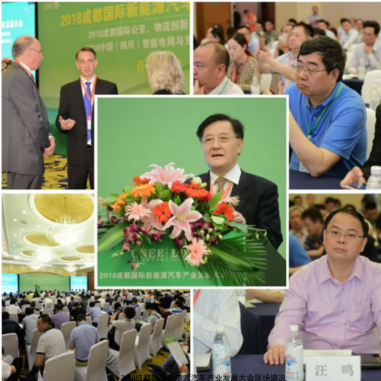
2018成都国际新能源汽车产业发展大会现场盛况

展会同期举办以“创新发展，开放共享”为主题的2019成都国际新能源汽车产业发展大会，将邀请包括国家工信部原部长李毅中、科技部原副部长张景安、商务部原副部长魏建国、国家发改委综合运输研究所所长汪鸣、中国工程院院士陈清泉、中国科学院院士欧阳明高、中国汽车工业协会副秘书长叶盛基在内的50多位政府主管部门领导及1000多名权威行业商协会的专家学者、新能源汽车企业高管代表共同出席，围绕“移动互联网+时代下的新能源汽车智慧出行”、“大数据时代中的智能驾驶生态”、“后补贴时代的新能源汽车产业格局”、“创新驱动汽车材料多元发展”等热点话题，分享新思维、交流先进经验。