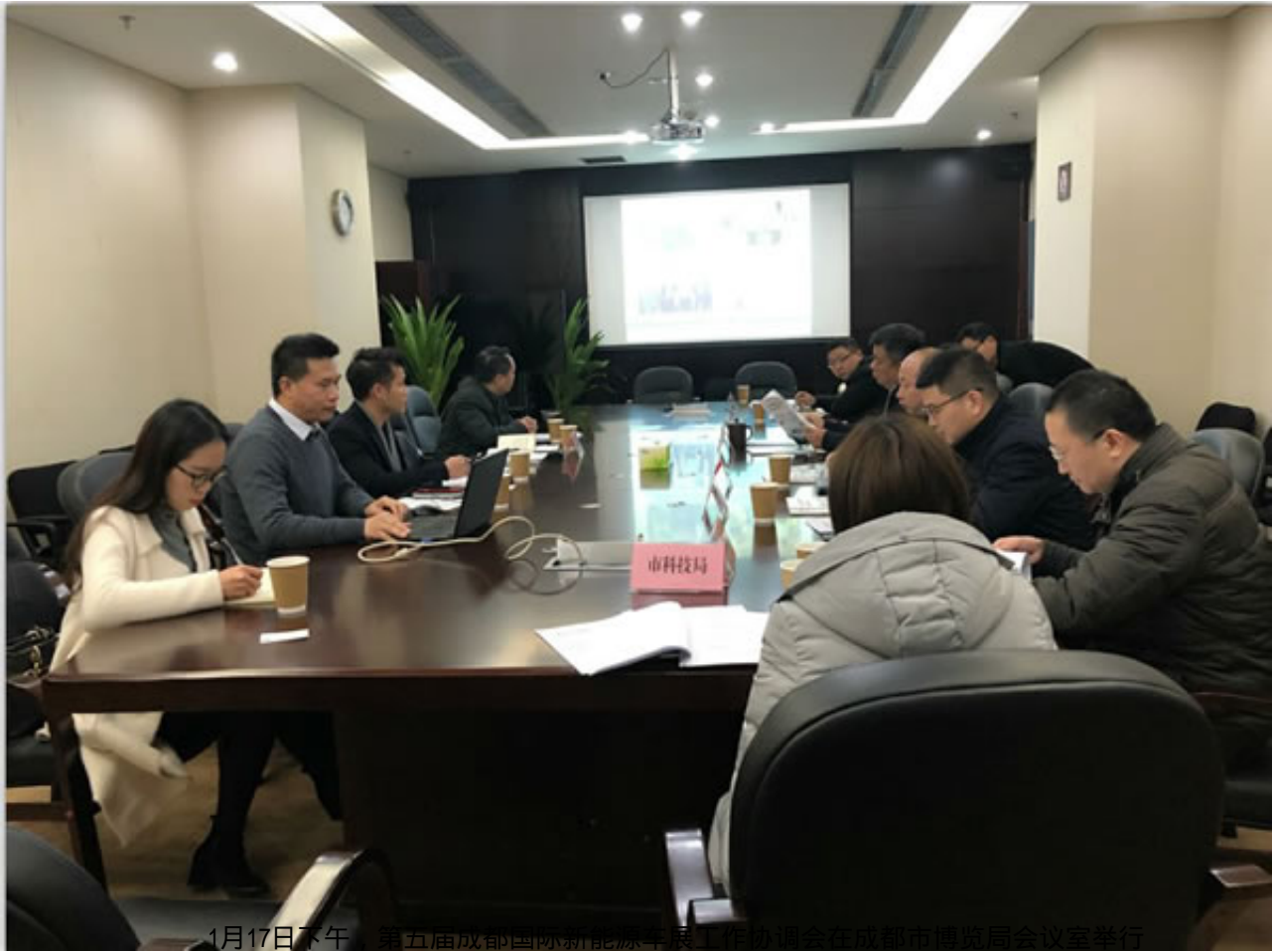
1月17日下午，第五届成都国际新能源汽车展工作组在成都博览局会议室举行

会展业是现代服务业的重要组成部分，具有较强的经济集聚效应、辐射带动效应和城市品牌效应，在助推产业、拉动消费、服务民生、扩大开放、营销城市等方面的积极作用日益凸显，已成为拉动城市经济发展的重要力量。为加快促进会展业与产业融合，推动成都市新能源汽车产业发展和迈上新台阶，近日，成都市人民政府领导批示，由成都市经济和信息化委员局、成都市发展和改革委员会、成都市商务局、成都市博览局、成都市科学技术局、成都市生态环境局、成都市新经济发展委员会等七个政府部门作为2019第五届成都国际新能源车展的支持单位，组织全市各区县相关单位和企业参与展会，全力协助振威展览在成都打造一个全国乃至全球知名的国际性新能源汽车展览会。