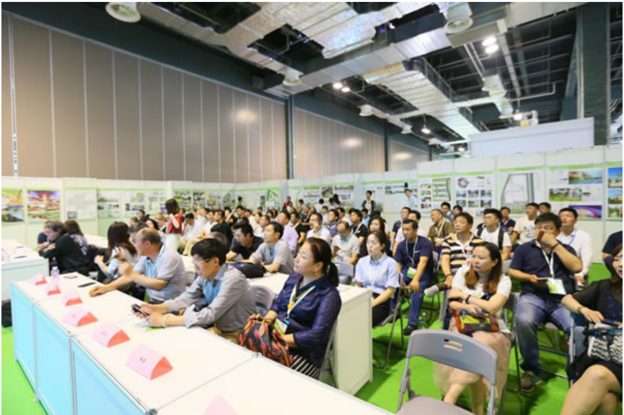
GLC2019 观众预登记系统已上线

展会期间还将举行2019世界人居环境科学发展论坛暨第九届艾景学术分享会，REARD景观设计与城市再生主题论坛，公园、主题乐园建设及无动力游乐设施应用论坛，立体绿化行业发展论坛，园林绿化产品供需双方交流会等精彩活动，敬请期待。