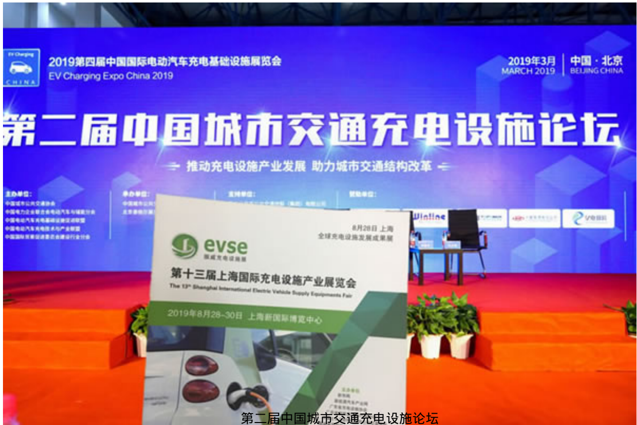
第二届中国城市交通充电设施论坛