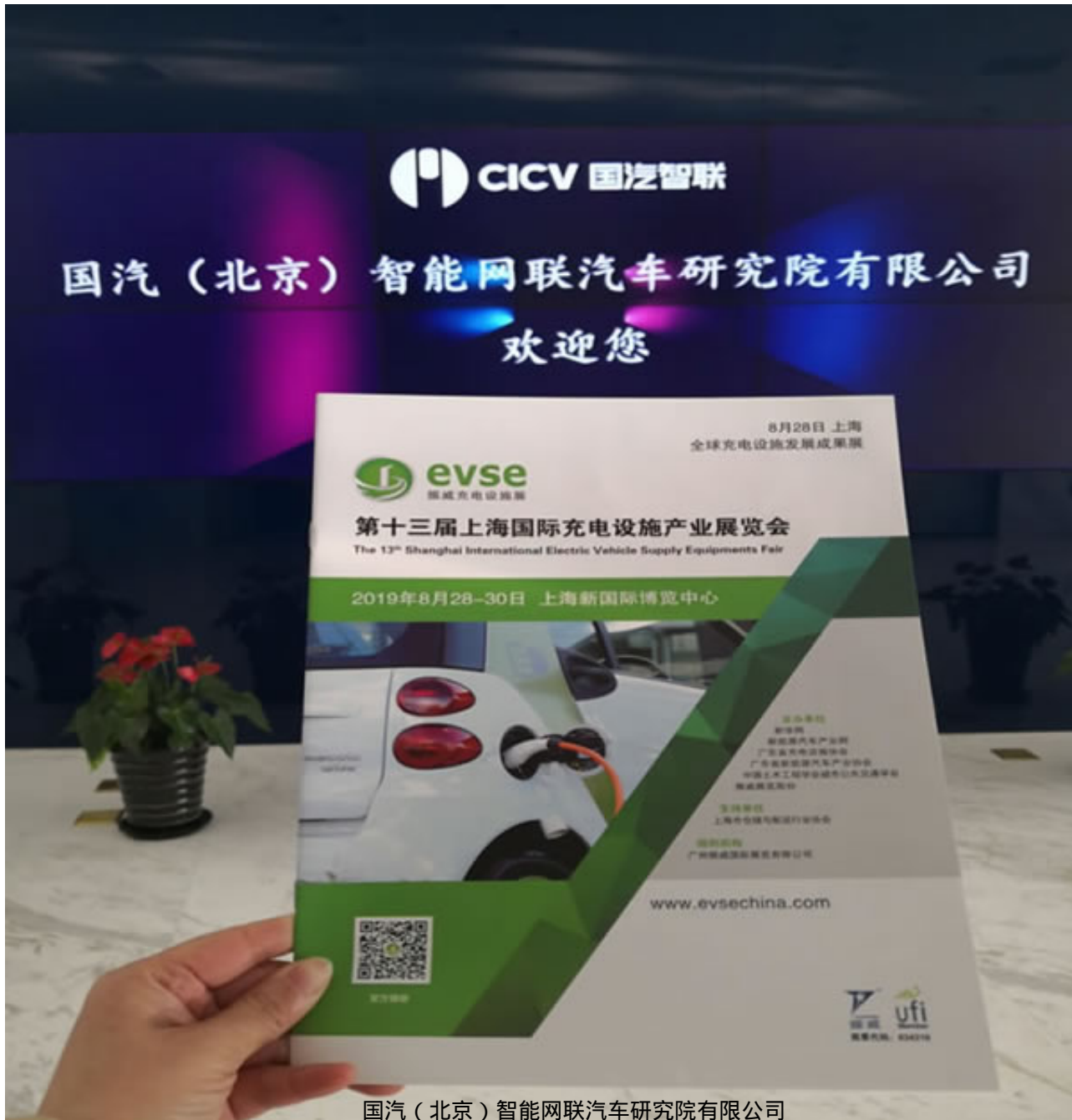
国汽（北京）智能网联汽车研究院有限公司