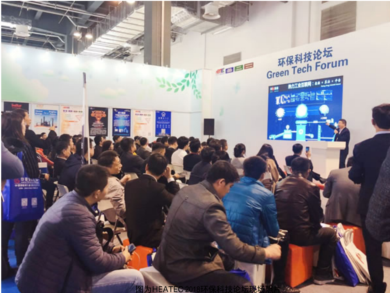
图为HEATEC 2018环保科技论坛现场照片

深耕国内外市场，把握行业最新动向，上海国际供热技术展览会（HEATEC 2019）将全方位展示行业现状及发展趋势，指引前进的方向，共同促进新技术新产品的进步与推广。智慧供热，共创未来！