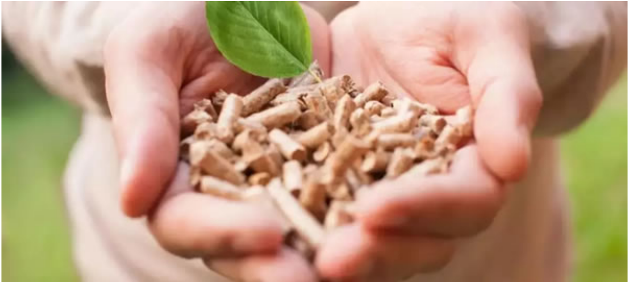
行业旗舰盛会 企业沟通桥梁

同时《中国新能源网》旗下开设《中国生物质能源网》、《中国生物质锅炉网》等面向生物质设备、生物质供热工程企业的平台，共有800多家生物质设备企业注册加入了这些平台。为相关企业的品牌推广、行业的数据信息整理归集起到了重要作用。