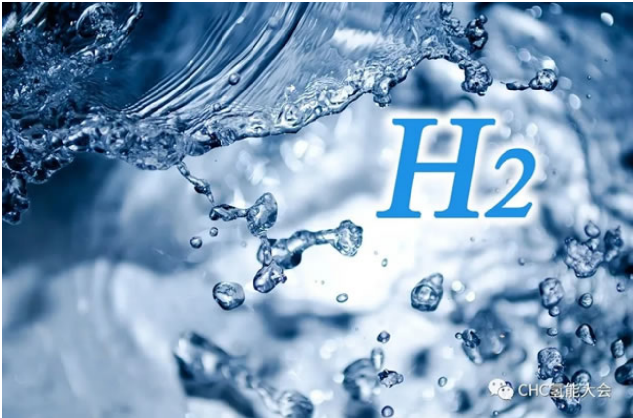
CHSC 2020中国（国际）氢能安全大会暨展览会

如发生重特大事故将对整个产业造成致命性的打击。所以无论是在制氢、运氢、储氢、用氢的任何一个环节，业内必须形成广泛共识，通过严格自律、强化标准、技术保障、规范流程等各项措施，共同保障氢能安全！