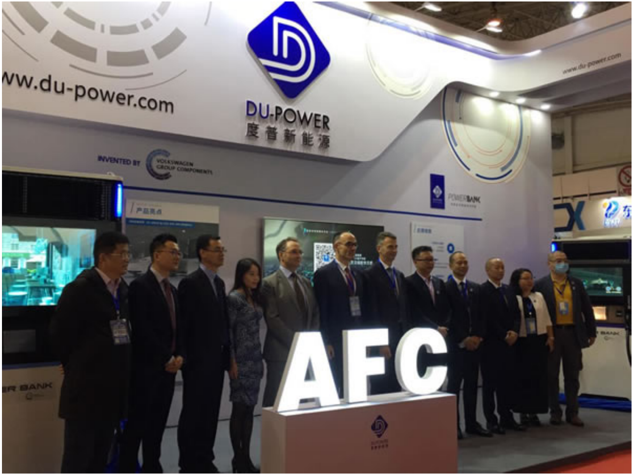
专注高品质采购，各地观众接踵而至

观众是展会的灵魂，专业观众的含金量是企业参展效果的重要保障。展会一直以“促进展商现场达成交易是我们的唯一追求”为目标，积极邀请产业园区、科研院所、行业企业等专业采购商到会参观采购，为国内外企业搭建贸易对接、交流合作的桥梁。