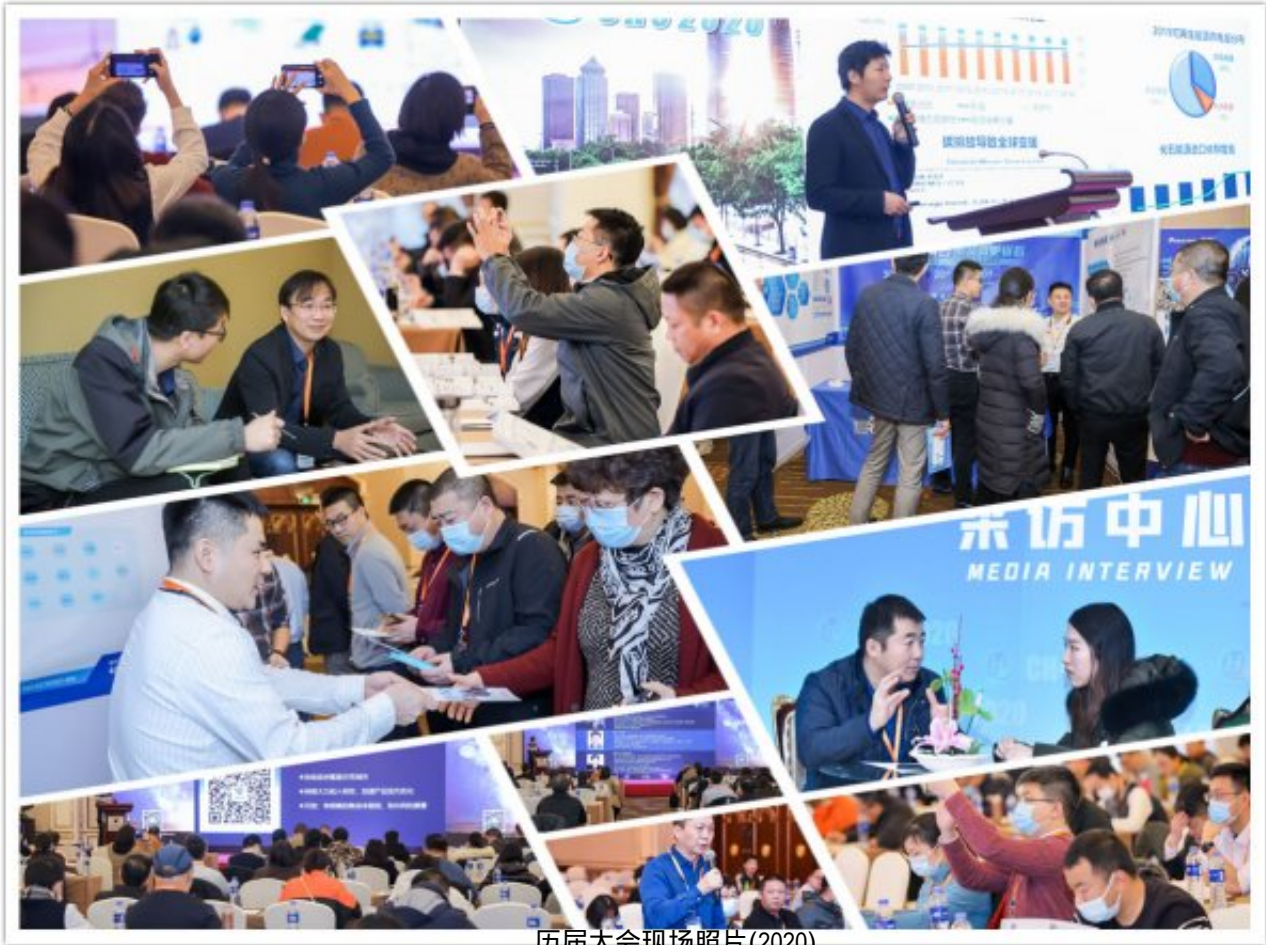
历届大会现场照片(2020)