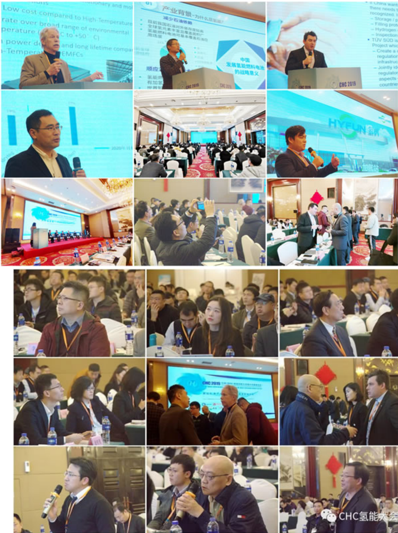
历届大会现场照片(2019年12月)