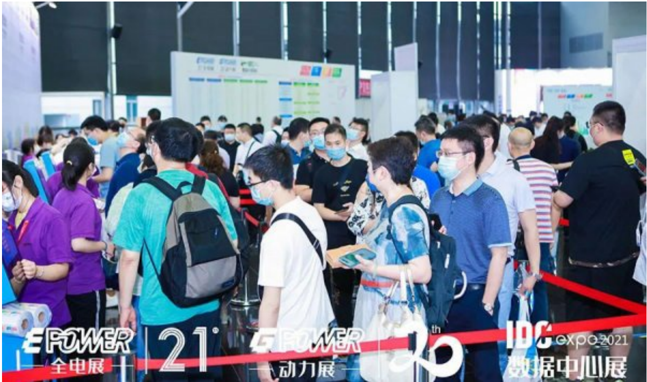
名企齐聚，共享行业盛会

为期三天的展会，700余家国内外参展企业带来数据中心设备及运维、物联网与电力行业结合新兴技术，城市综合解决方案，储能、燃气智能发电，面向能源互联网的电力保护与控制，新型智能配用电设备，智能电网、输配电等自主创新技术、新产品、新应用，在46000平方米展厅中，充分展现品牌魅力，满足行业转型升级的产品采购新需求，推动产业低碳化、绿色化、智能化、高质量融合发展。