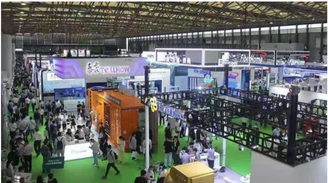
大咖云集，聚焦热门话题

在碳达峰、碳中和愿景下，利用清洁能源，大幅降低数据中心的能耗水平，建设绿色数据中心，系统推进电力用户侧管理创新、深化和升级，实现节约用电、环保用电、绿色用电，已经成为全行业发展方向和共同目标。展会期间，分别由CDCC主办的“2021中国数据中心绿色能源大会”、由上海新能源科技成果转化与产业促进中心主办的“2021综合能源服务产业暨电力用户侧技术发展高峰论坛”、由中国内燃机工业协会小汽油机分会主办的“第六届非道路点燃式发电机组研讨会”等隆重召开。主办方邀请华为、腾讯、中国电信、中国联通、中金、罗格朗、许继集团、易华录、世纪互联、美的集团、英维克、中兴通讯、青岛海尔、纳尔科、龙控智能、捷通、申通地铁集团、虹桥国际机场、上海能源环境交易所、国网上海综合能源服务有限公司、国网能源互联网研究院、华东都市建筑设计总院、国网上