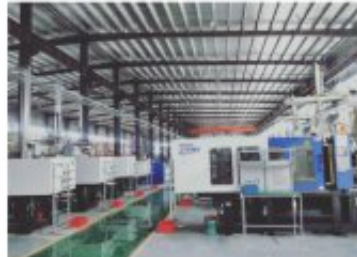
塑料制品注塑产线