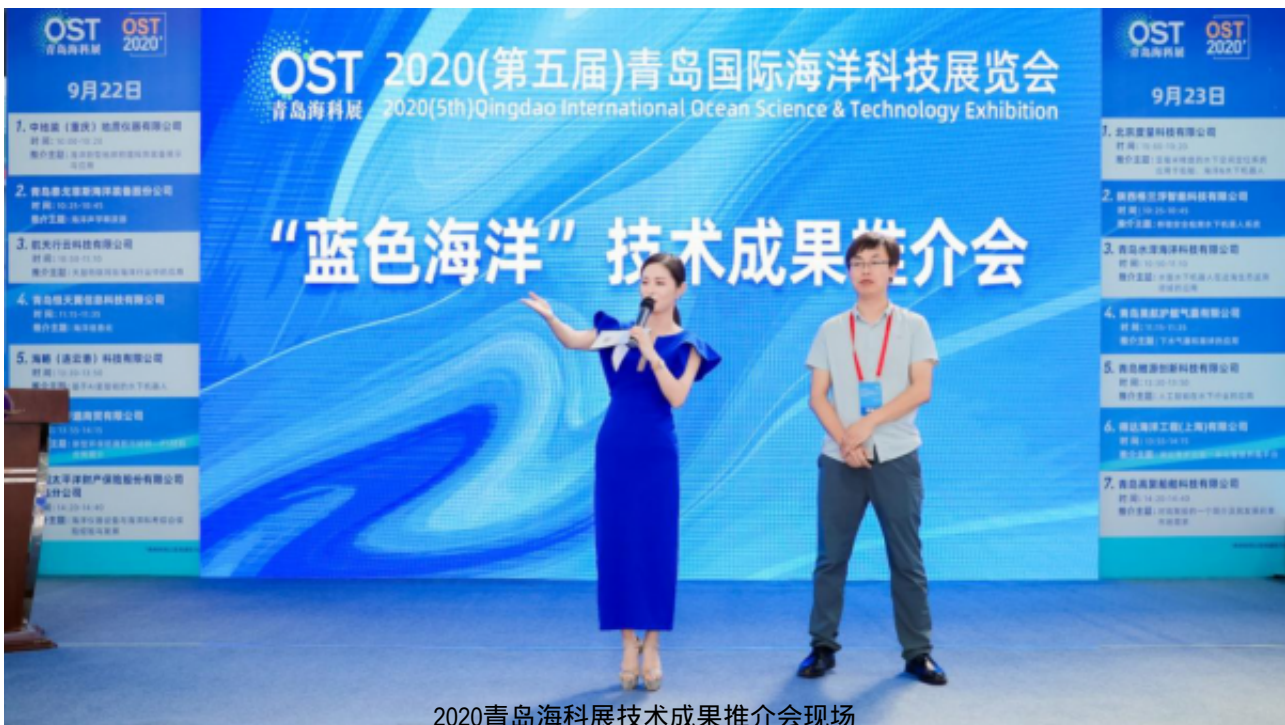
2020青岛海科展技术成果推介会现场

其实，不论是会展、论坛还是会议也好，其本质都应该是一个平台——把信息、人才、技术、资本、人脉等优质资源都聚集起来、整合起来，然后深度地挖掘它。这就是平台思维方式。