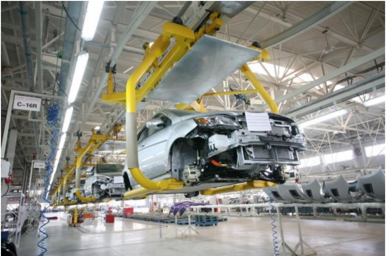
新能源车渗透加速

新旧势能格局转换，产业“新四化”转型，汽车行业将迎巨变。为响应十四五规划，重庆在未来5年计划打造五千亿级汽车产业集群，大力推进重庆在人工智能、物联网、新能源、汽车制造等领域的发展，其中新能源、智能化成未来重点攻关项目。