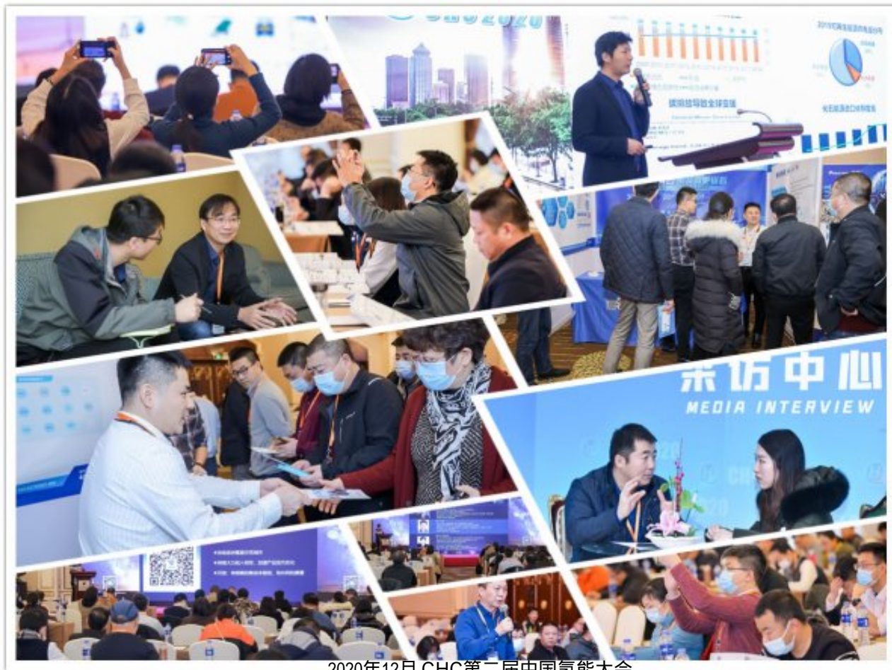
2020年12月 CHC第二届中国氢能大会