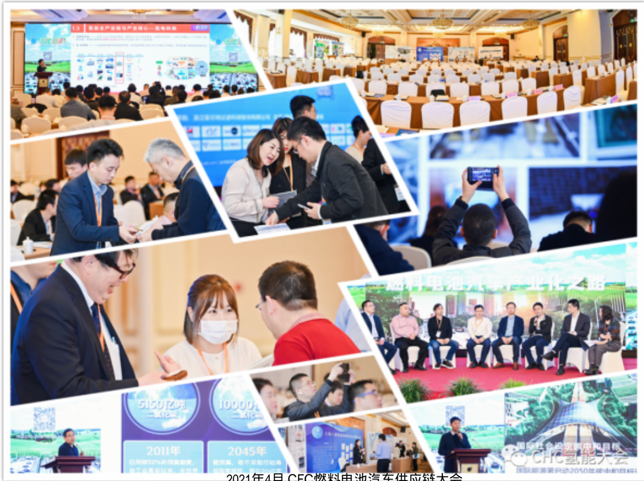
2021年4月 CFC燃料电池汽车供应链大会