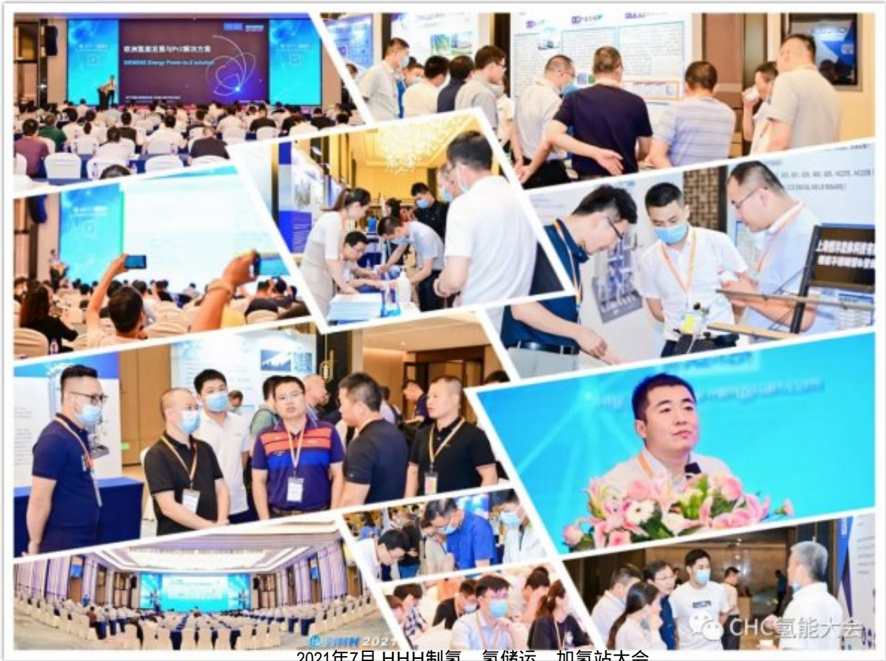
2021年7月 HHH制氢、氢储运、加氢站大会