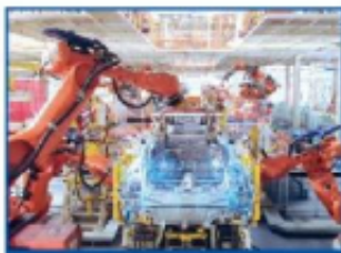
加工设备与制造装备