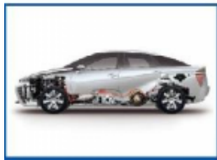
燃料电池及核心技术