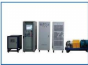
测试测量与质量监控