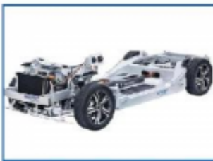
驱动电机及核心技术