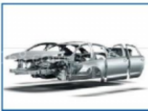
材料及轻量化技术