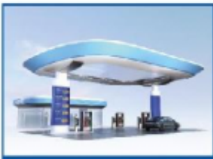
充换电及配套设施