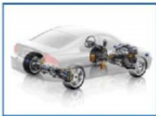
汽车电控及核心技术