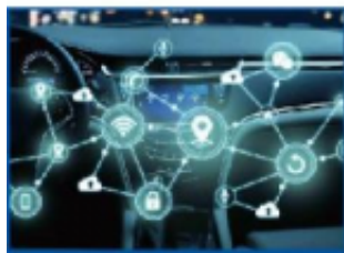
智能网联与汽车电子