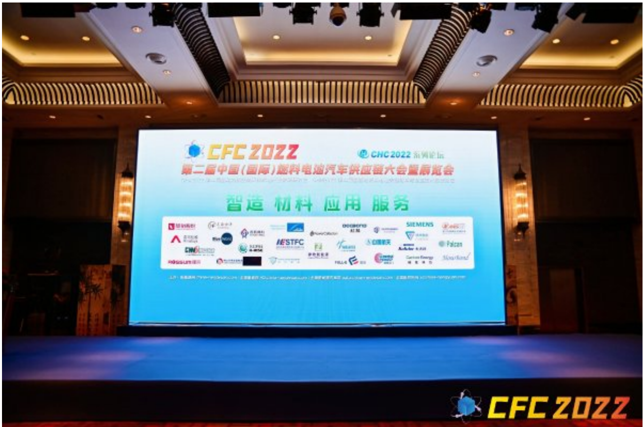
由新能源网、全球氢能网、全球新能源汽车网联合氢能、燃料电池及相关产业链企业、科研团体共同联合发起的《CFC 2022中国（国际）燃料电池汽车供应链大会暨展览会》于6月8日在杭州顺利开幕！