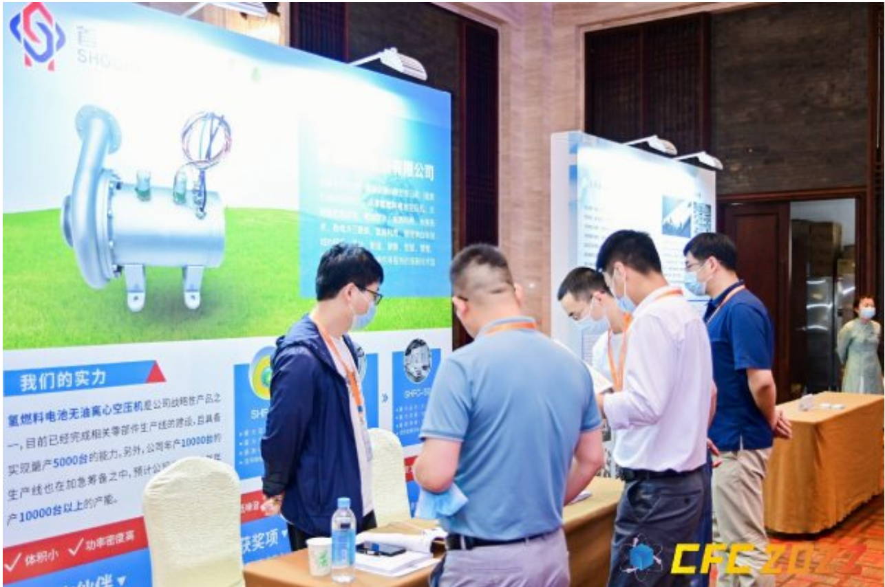
在本次大会上有多位氢能大咖分享产业趋势与产品技术。