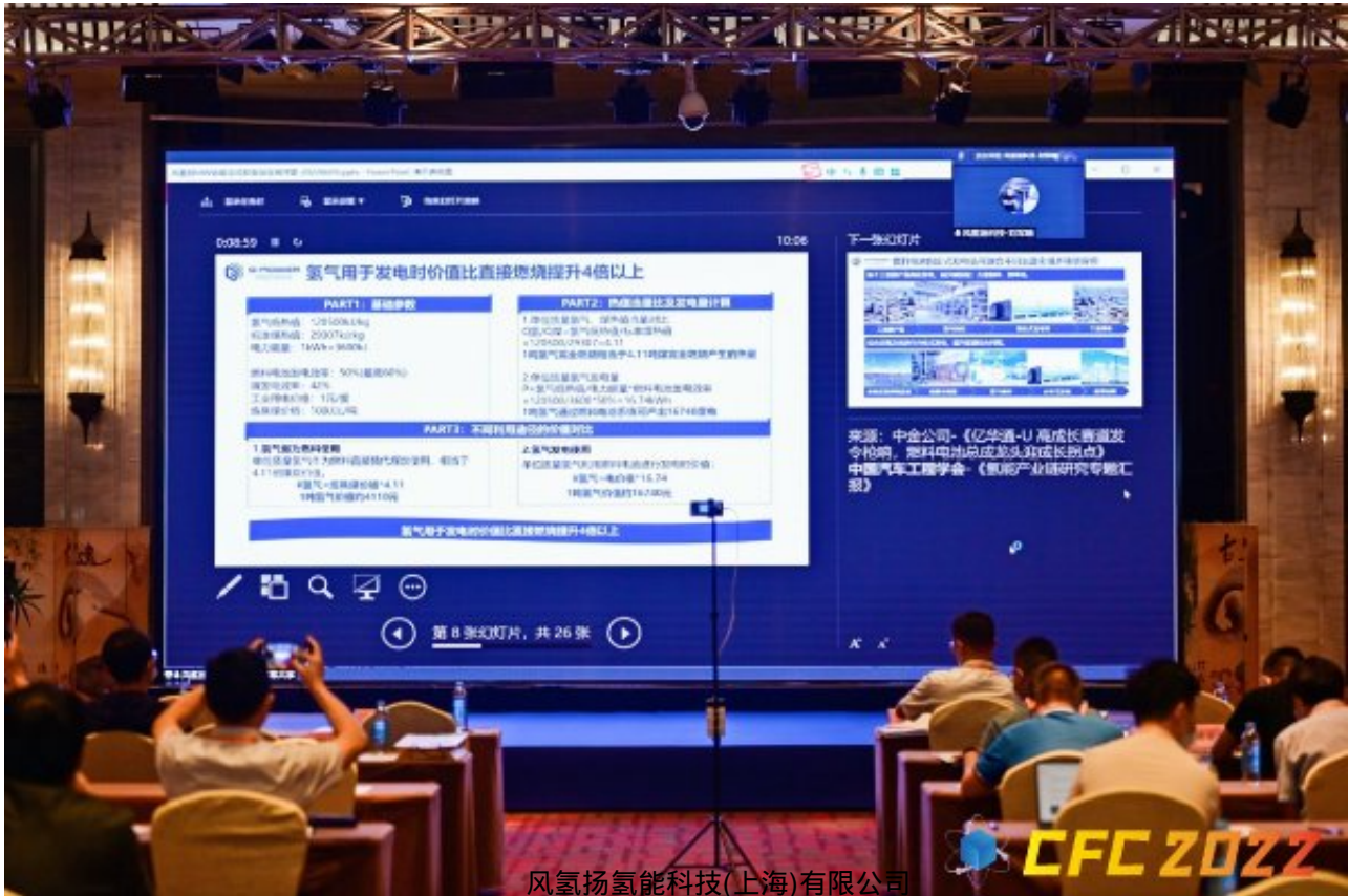
风氢扬氢能科技(上海)有限公司