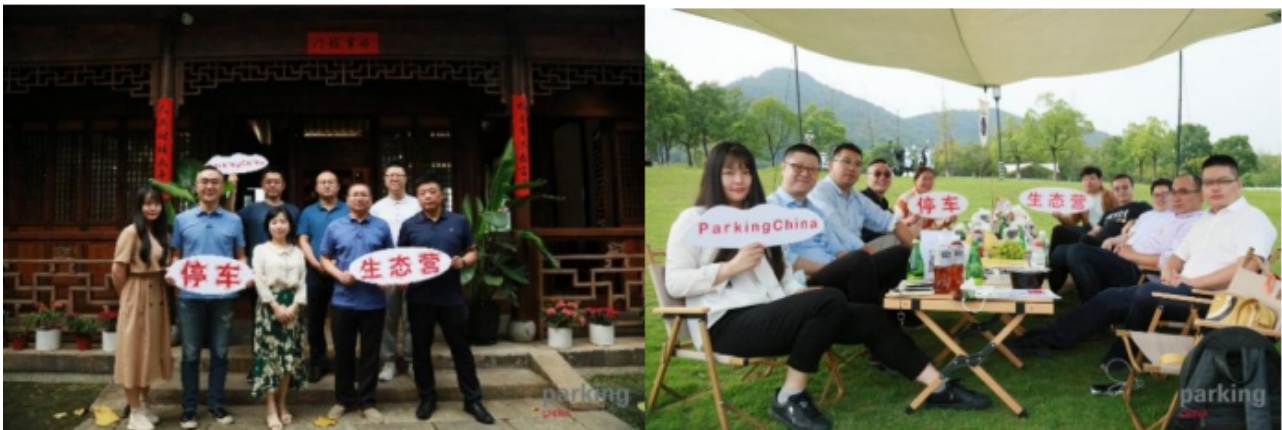
同期高峰论坛，把握市场资讯

展会开通集【智】广议—智慧停车改变出行生活栏目，线上为停车行业带来最新停车资讯及热点政策话题解析。另外，停车生态营活动在多地成功举办，获得了行业的高度认可，为参加者提供了供需对口机会。