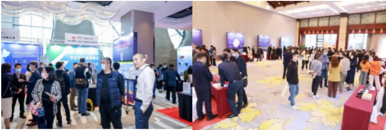
打造停车新生态专区，开创新战略蓝海

2023年展会全新打造“新能源双破”及“车联网未来出行”两大专区，呈现最新市场发展趋势。