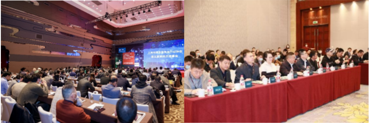
智慧生态平台创造更多商机

主办方已成功打造出以上海国际智能建筑展览会，上海国际智能家居展览会、上海国际智慧办公展览会为代表的一系列“智·联”主题品牌展览会。将停车与5G.IoT.AI、大数据、云计算、智慧社区和智慧城市等多个行业领域融合，向观众展示一场汇集行业创新技术和智能产品的盛会。将展会打造为促进行业资源整合，技术互通，平台开放以实现行业共赢的专业平台。