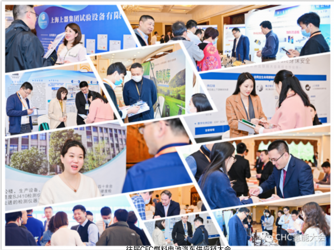
往届CFC燃料电池汽车供应链大会