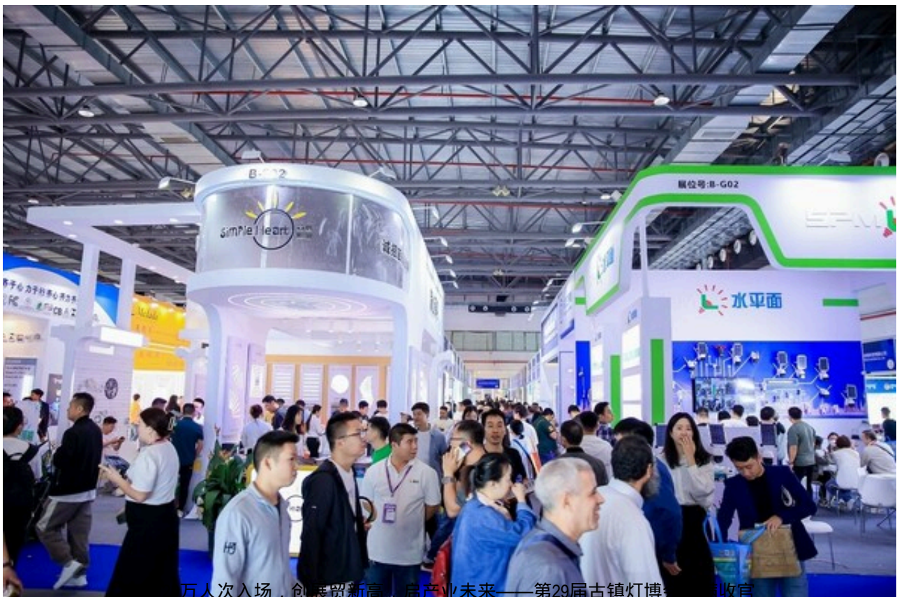
超29万人次入场,创展贸新高,启产业未来——第29届古镇灯博会收官

随着"跨界+照明"的边界突破,多业态融合延伸的"新赛道"特色也越发突出。这成为本次灯博会的关键词和鲜明标签,智能照明与居家生活融合,与生产经营方式融合,与城市景观融合,与文旅产业融合,实力诠释"光超乎所见"。