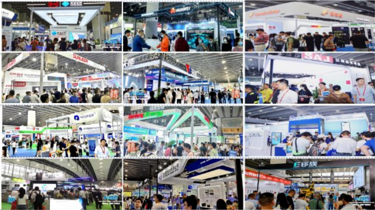
4000+家储能、电池、氢能、光伏企业同场构建清洁能源产业链生态圈

WBE2024第9届亚太储能技术及应用展聚焦储能电芯、大储、工商业储、家储、户储、户外便携储能、光储一体化领域，定于2024年8月8-10日在广州·中国进出口商品交易会展馆A区举办，与2024世界电池储能产业博览会暨第9届亚太电池展一同规划广交会展馆A区一楼、二楼13大展馆，16.5万平方米展览面积，展商超2000家，其中电池、储能参展企业将超600家，加上B区光伏展，将形成超过250,000平米的超大会展平台，参展企业将达4000余家，参观观众将超300000人次。