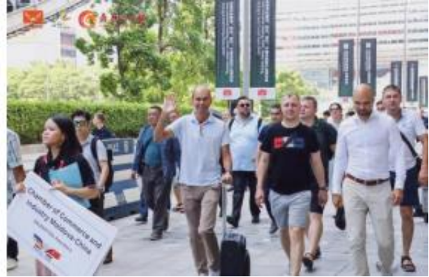
高手云集，共议双碳发展新前景

巅峰对话，共图新生。博览会同期将举办2024中国光伏行业发展高峰论坛、2024广东新型储能产业高质量发展论坛暨优秀企业颁奖盛典。多位光储领域相关协会领导、行业专家、企业代表、专业媒体将共聚现场，围绕“推动新能源发展·促进达成双碳目标”的主题同场碰撞光储赛道高速、高质量发展思路，多视角、多层次解码行业发展创新方向，深度探讨分布式光伏、高效组件、用户储能、零碳升级、数字化赋能等光储长效解决方案。