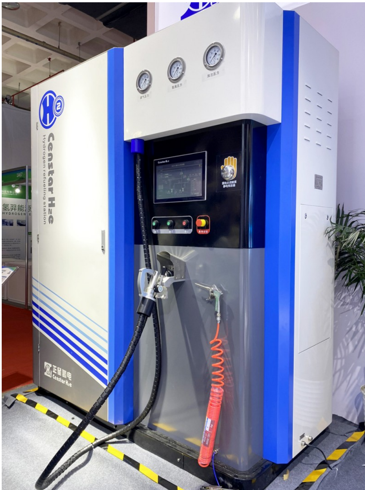
正星氢能集成式增压加氢装置，又称多功能MINI加氢站，是正星氢能针对氢能社会应用场景研发的2.0时代产品。