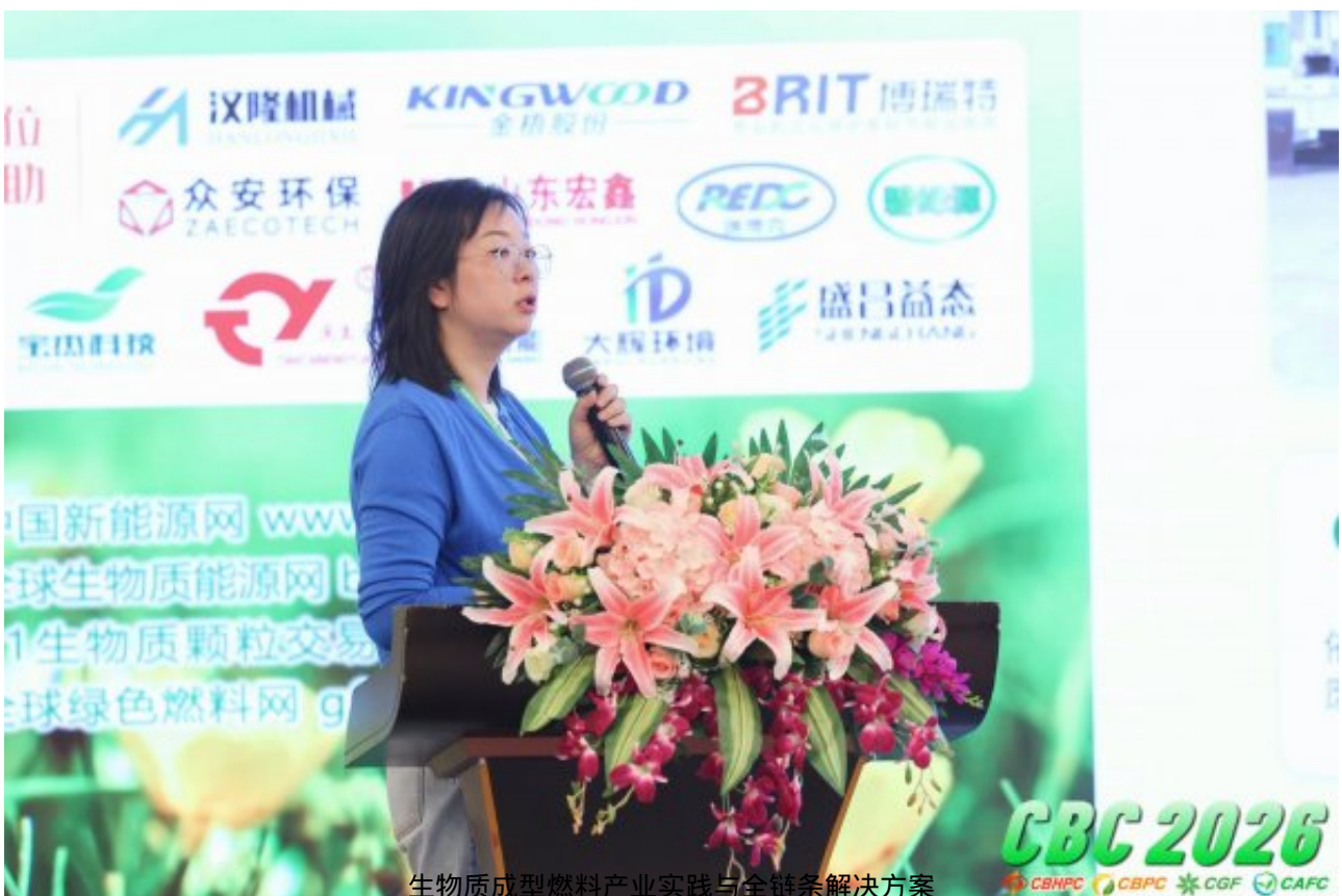
生物质成型燃料产业实践与全链条解决方案