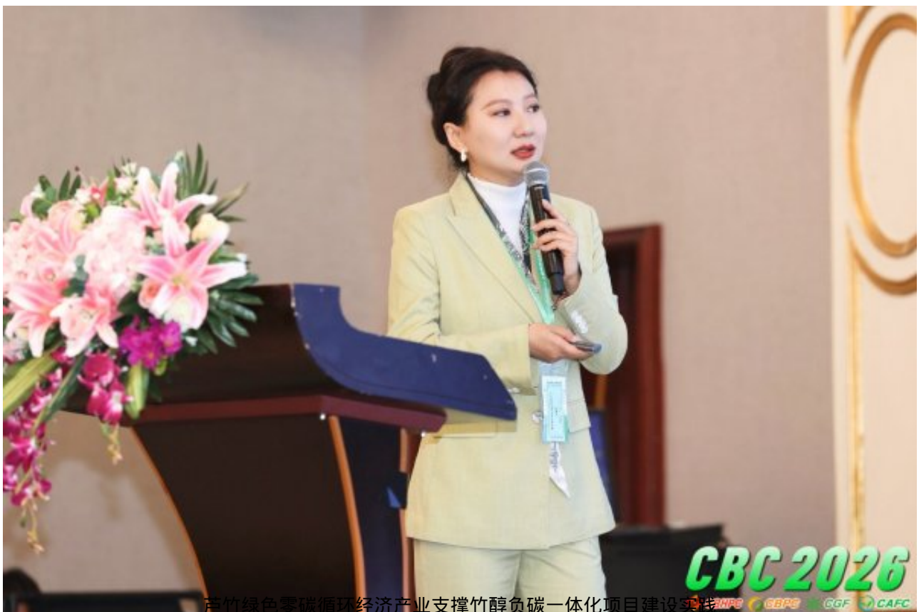
芦竹绿色零碳循环经济产业支撑竹醇负碳一体化项目建设实践