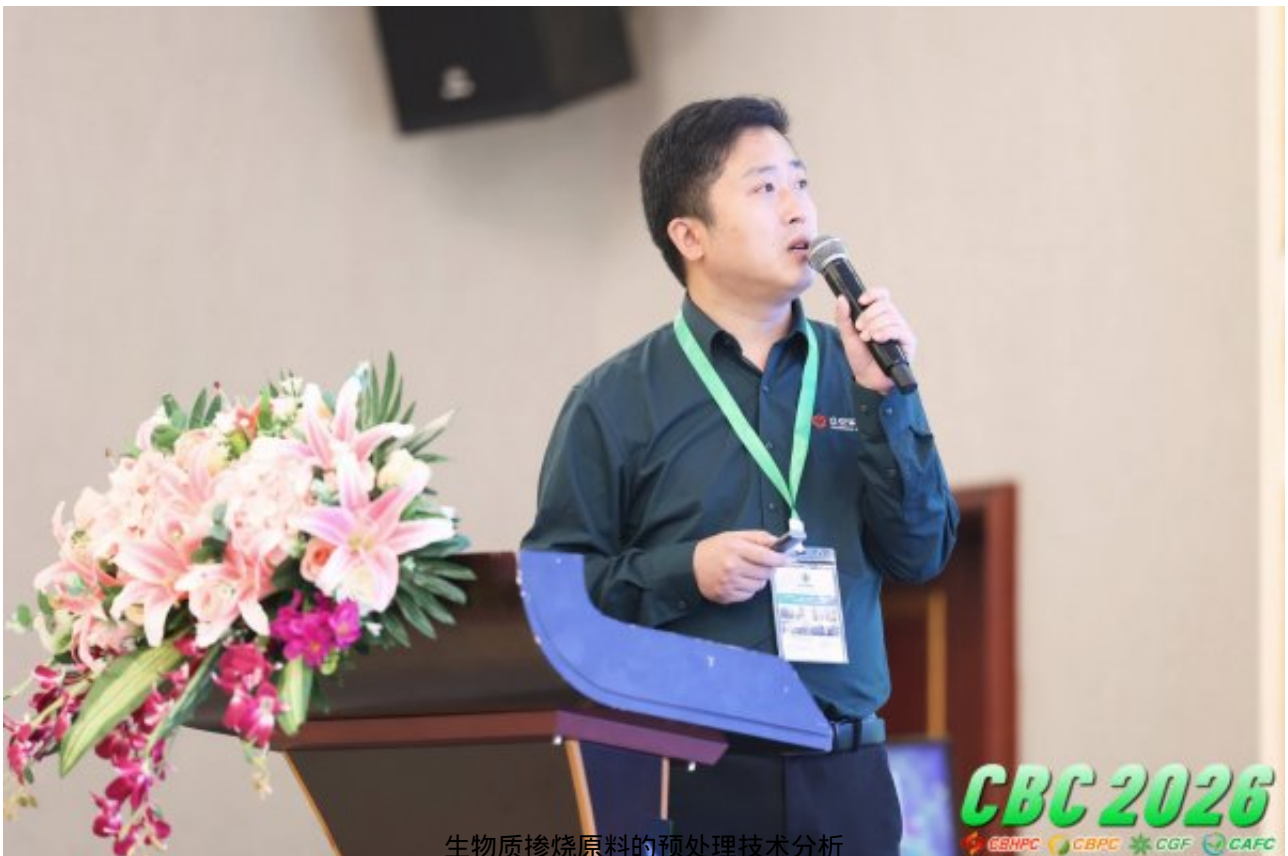
生物质掺烧原料的预处理技术分析 郑州众安环保技术有限公司 常向坤