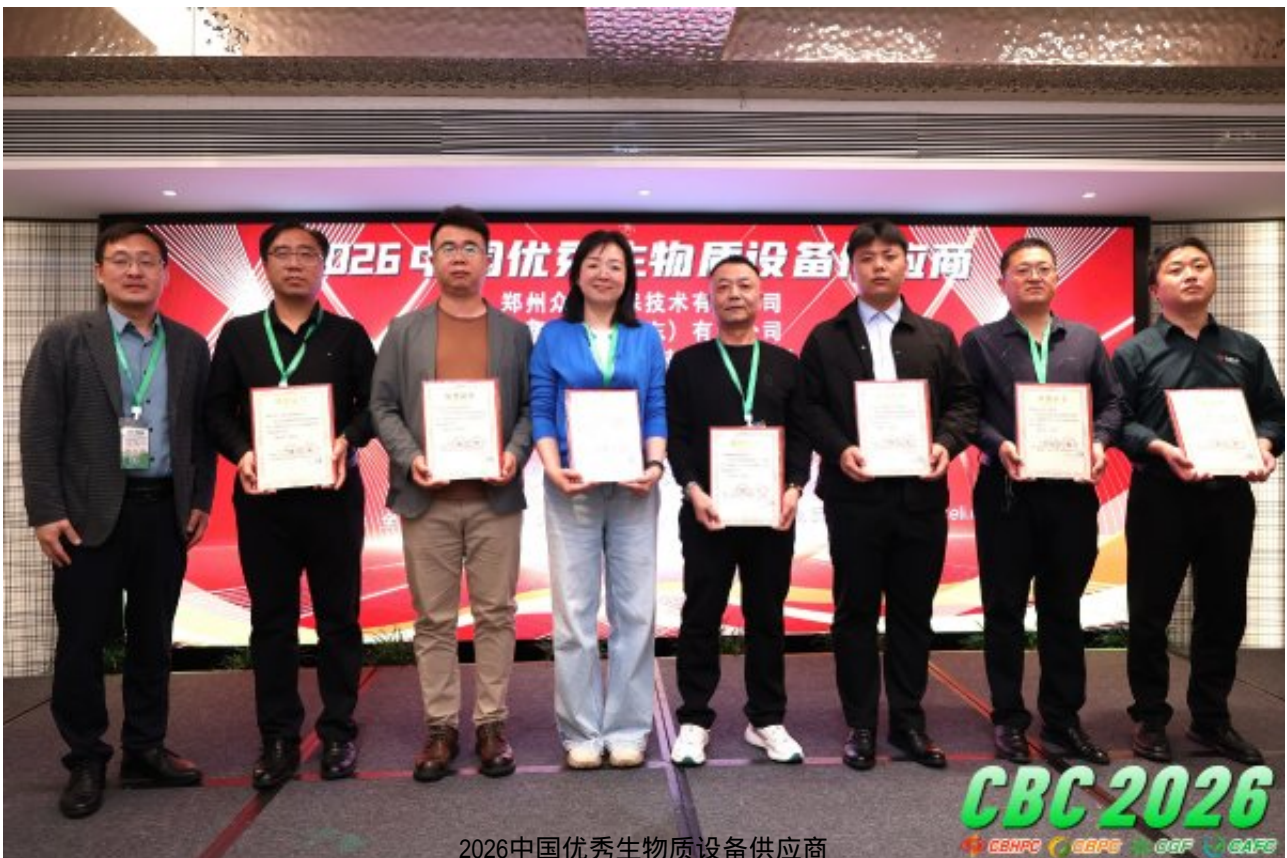
2026中国优秀生物质设备供应商