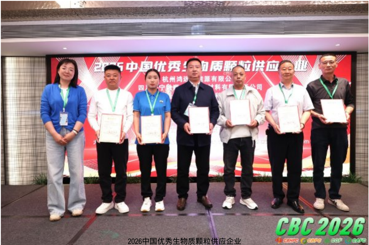
2026中国优秀生物质颗粒供应企业