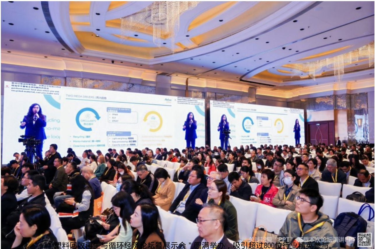
“塑料回收再生与循环经济论坛暨展示会”圆满举办，吸引超过800位行业精英参与。

的政策趋势、技术创新及市场洞察。“科技讲台”震撼发布超过40项创新科技，覆盖包括创新包装方案、绿色减碳方案、车用塑料方案等五大主题。