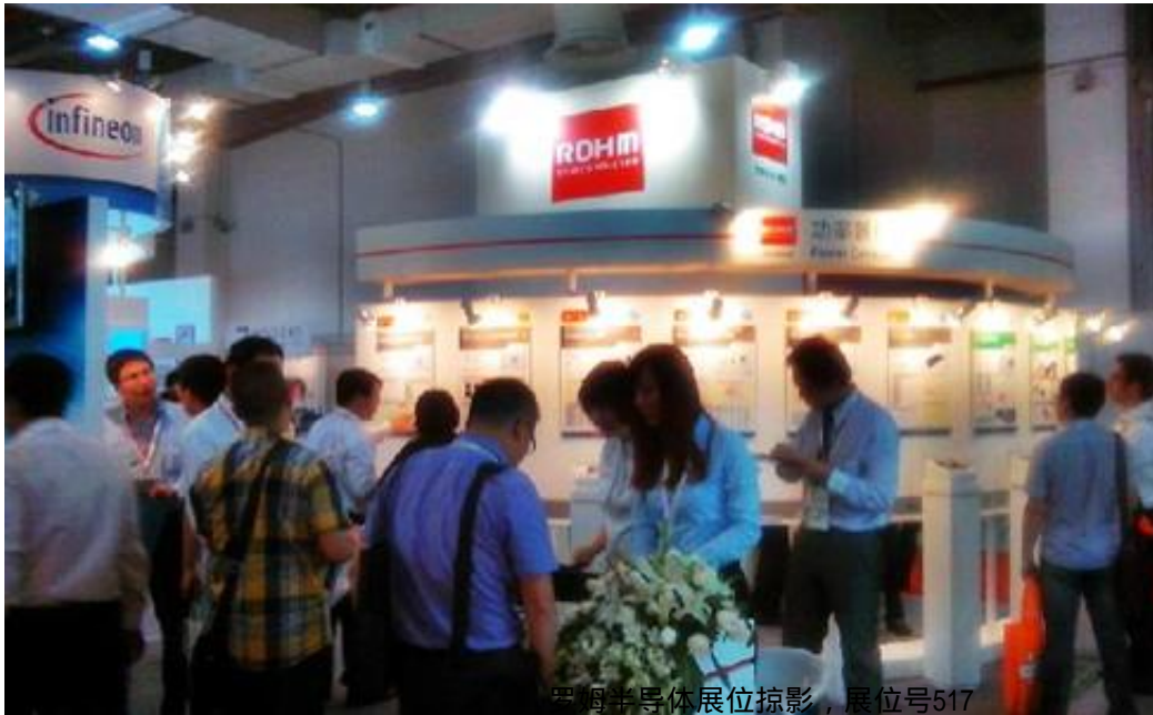
罗姆半导体展位掠影，展位号517

业内知名的赛米控、英飞凌、三菱电机、富士电机、日立集团、CT-CONCEPT、莱姆LEM、罗姆半导体、CURAM IK、EBG、AVX、法国AUXEL、美国国家仪器、安捷伦、赛晶电力电子、宝威电子、益蒂莱、飞磁、罡境电子、赫格纳斯、日本轻金属、巴斯巴科技、佰人科技、中国南车时代、中国北车永电、上海鹰峰电子、罗杰斯、上海申和、富士德、无锡盛展、东莞翰胜金属、ITG、江海电容器、江苏宏微科技、MERSEN、华尚新源、建伦实业、普尔胜、美磁、、青铜剑、科视达、睿查森、润奥电子、斯达半导体、史陶比尔、SONOSCAN、集盛兴泰、台基半导体、西电机电、东普电器、华晶整流器和常州杜安等国际知名电力电子厂商的齐聚。这是一次难得的能同时见到众多电力电子厂商的绝佳机会。