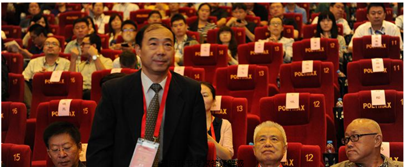
听众认真答疑解惑

讲者有心，听者有意，本届研讨会在提供沟通与学习平台的同时，如何与更广泛的地下空间领域从业人员进行交流成为了会后首要完成的课题。