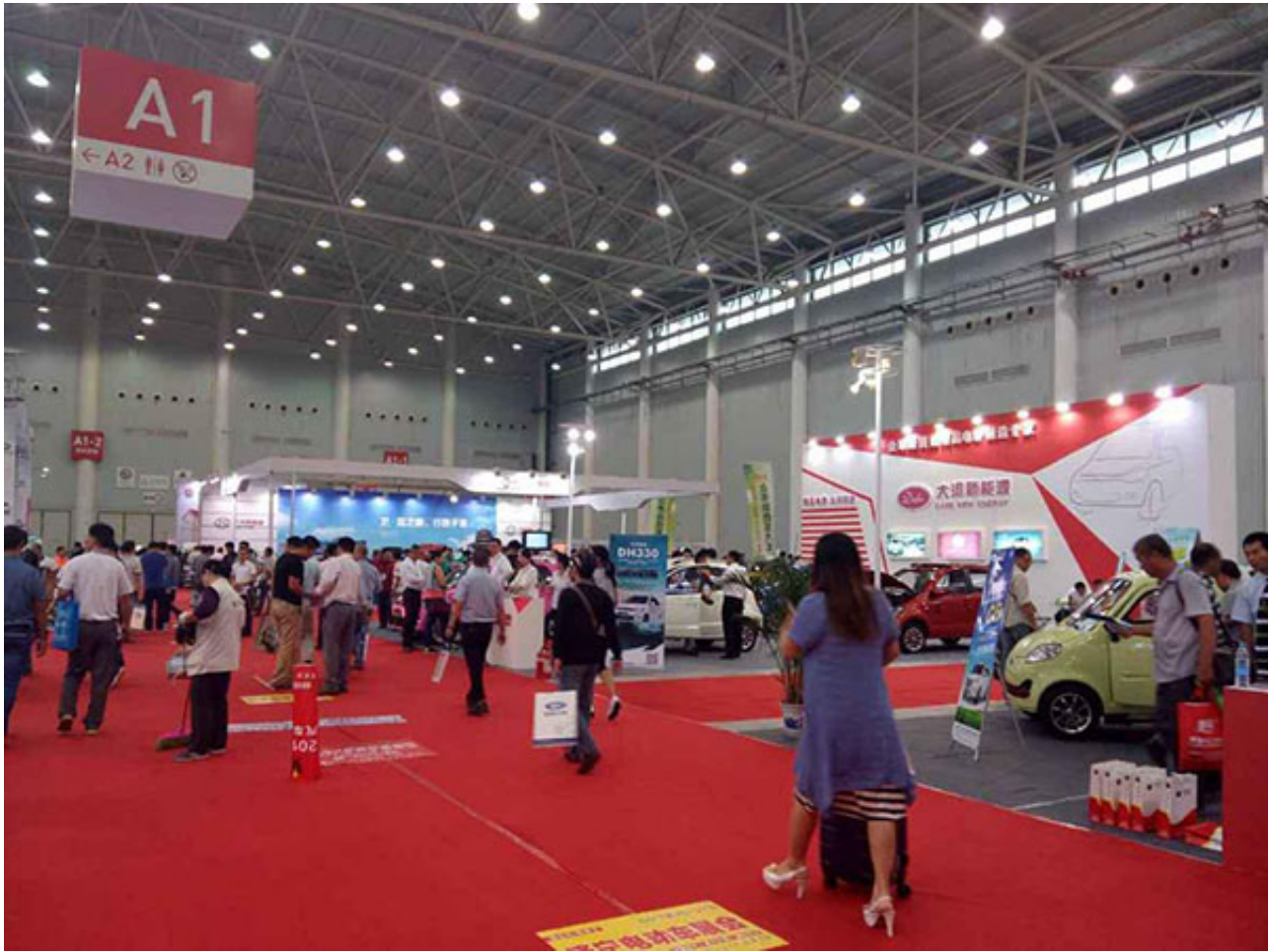
2015第二届中国（武汉）国际新能源汽车电动车展览会正是本着响应国家号召、造福新能源汽车行业的原则，为制造商、经销商提供交流的契机和平台，为促进经济发展和环境保护贡献力量。