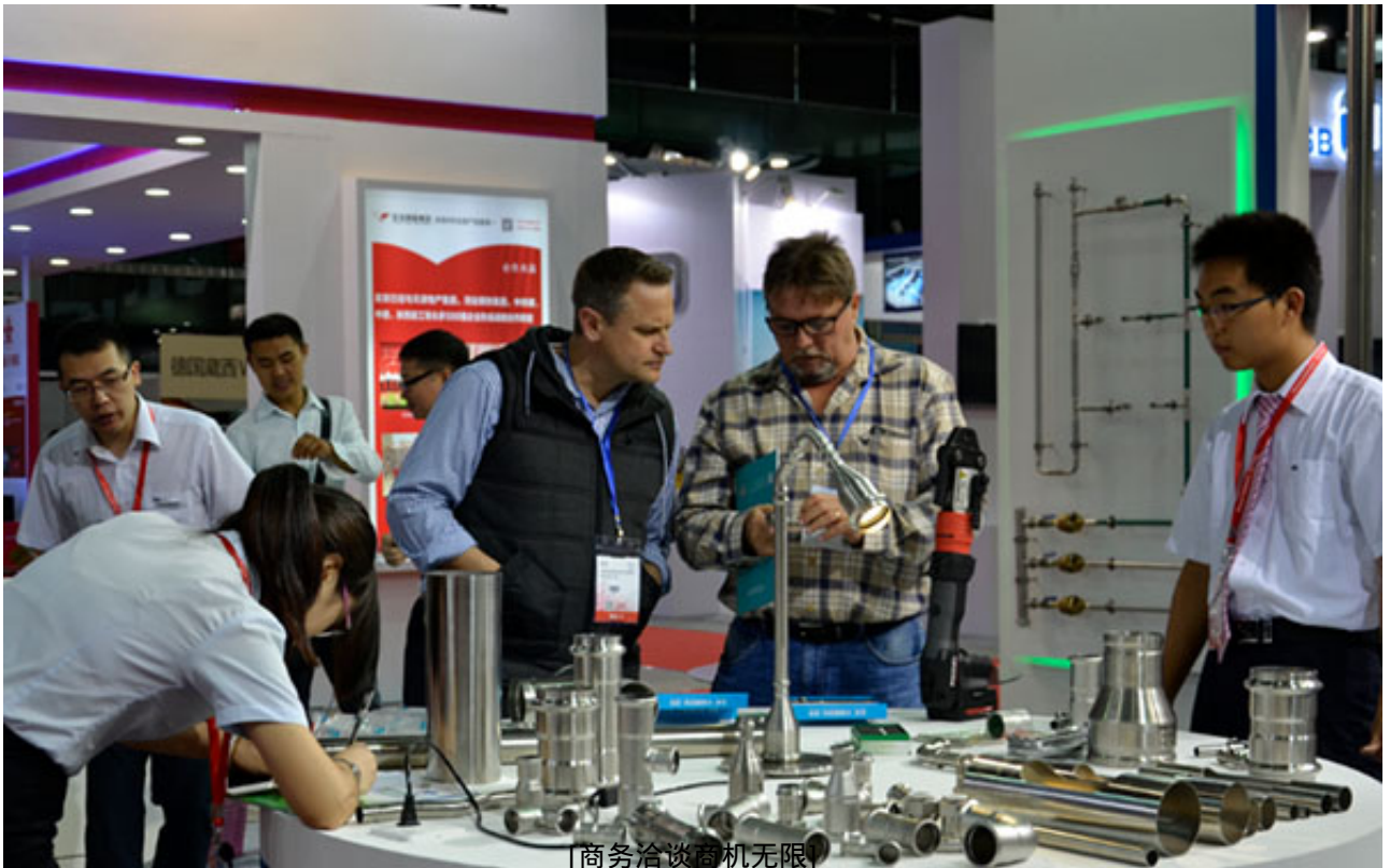
[商务洽谈商机无限]