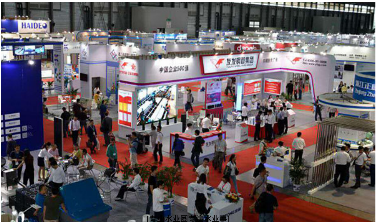
[专业水业圈专注水业事]

今年展示面积达到11,000平方米，比上届递增35%。为期3天的展会吸引了来自29个国家及地区的企业和11,803名专业观众到场参观，同比增长13.8%。其中，境外及港澳台专业买家1825人同比增长37%。与会的展商及观众评价大会针对性及专业性都很强，并纷纷表示达到预期效果。