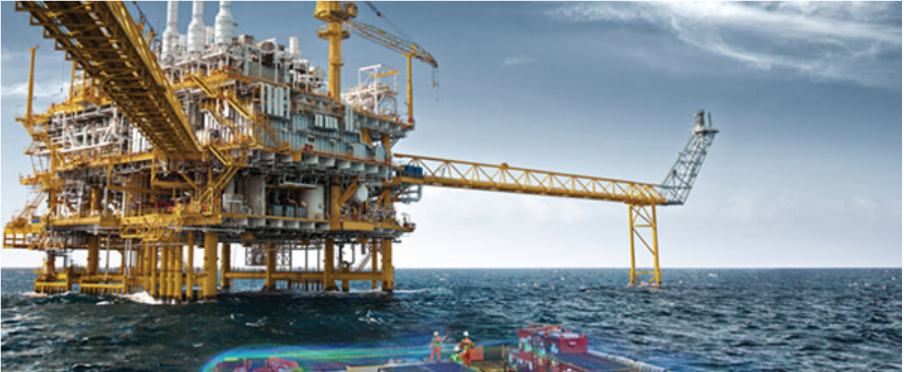
世界石油巨头齐聚cippe2016

全球最大石油展——第十六届中国国际石油石化技术装备展览会（cippe2016）将于2016年3月29-31日在北京·中国国际展览中心（新馆）召开。cippe作为一年一度的世界石油装备大会，得到国际展览业协会UFI的认证，是全球最高级别的展览会。cippe2016将有来自65个国家和地区的近2000家展商参与，其中世界500强企业46家，国际展团共计18个，预计专业观众近80,000名，展会面积达近100,000平米。