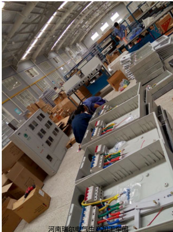
河南瑞尔电气生产加工车间