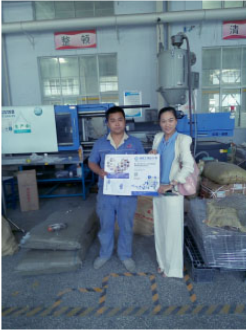
许昌瑞尔电气生产部韩部长与组委会留影，并表示会场采购自动化机械手臂、工控产品