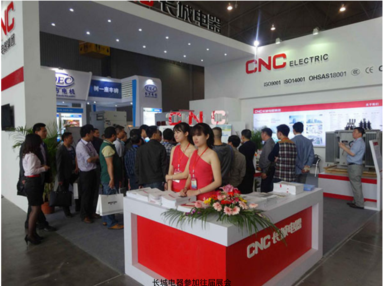
长城电器参加往届展会

专业观众特别是采购商数量的多少，决定了企业参展的效果，是展会能否成功的关键因素。继四川省水电集团、成都双流国际机场股份有限公司机电设备中心等企业之后，本周，韩国大韩贸易投资振兴公社(韩国贸易馆)、四川南网电力设计咨询有限公司、成都航利电气有限公司、成都中车电机有限公司等国内外30多家机构、企业，报名组团参观即将于8月3日—5日在成都世纪城新国际会展中心举办的“第十四届四川国际电力产业博览会”，许多机构、企业还表达了明确的机电设备采购需求，以及寻找合作单位的意向。