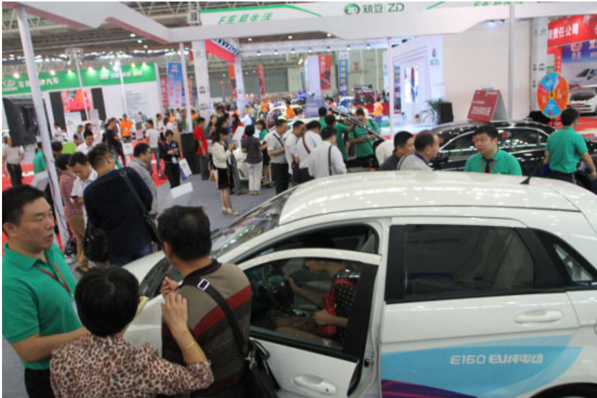
下半年市场到底怎么样？一起去南京和武汉看看吧！