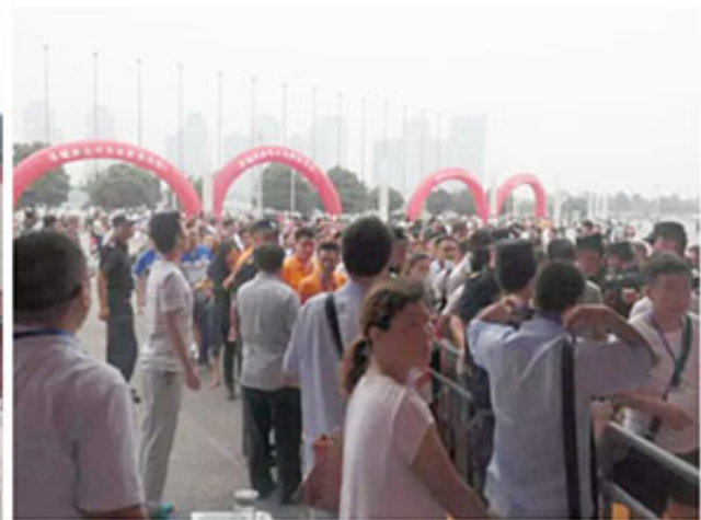
2017双展联动打造中西部最大智能制造和智慧物流商贸平台

应广大展商和采购商的贸易之需，中国郑州工业装备博览会2017年将展会时间调整至上半年6月2-4日，不变的品质更大的规模，与中部唯一物流展同期举办，以“智能制造、高效物流”为主题，深度对接产业转移，促进中部制造业转型升级，形成产业链互动共谋新发展，做到资源、质量、服务水平的全面升级，打造中西部最大智能制造和智慧物流商贸平台！